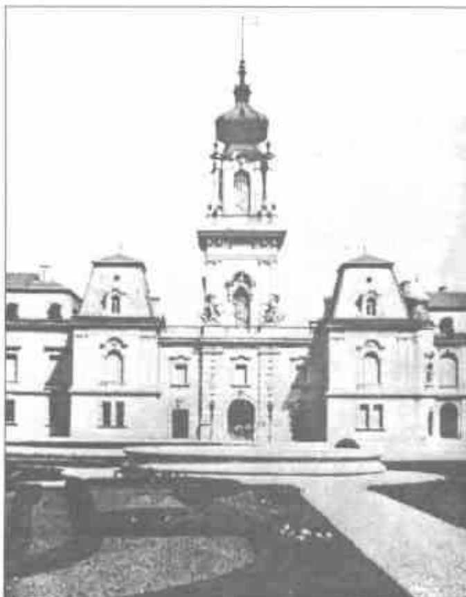
A központi épület