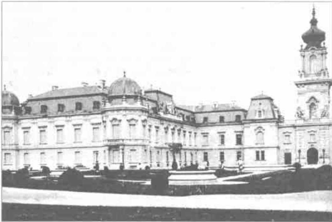
A Festetics - kastély