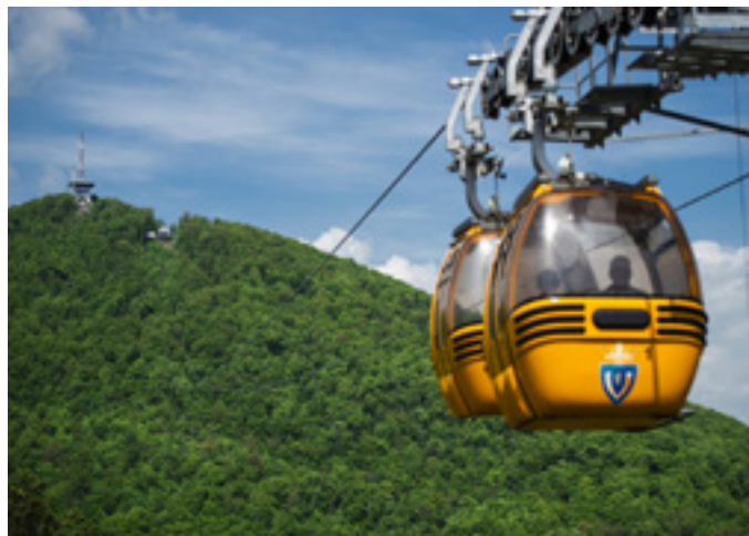
Zemplén Kalandpark, Sátoraljaújhely

Nagyobb borvidékeink felkészülten várják a kirándulókat nemcsak borral, hanem kulturális programokkal, tanösvényekkel és kitűnő éttermekkel is. Sopron, Eger, Tokaj, a Balaton-felvidék vagy Villány szőlőt gyalogosan vagy kerékpáron érdemes „beborongolni”, ha teljes élményre vágunk.