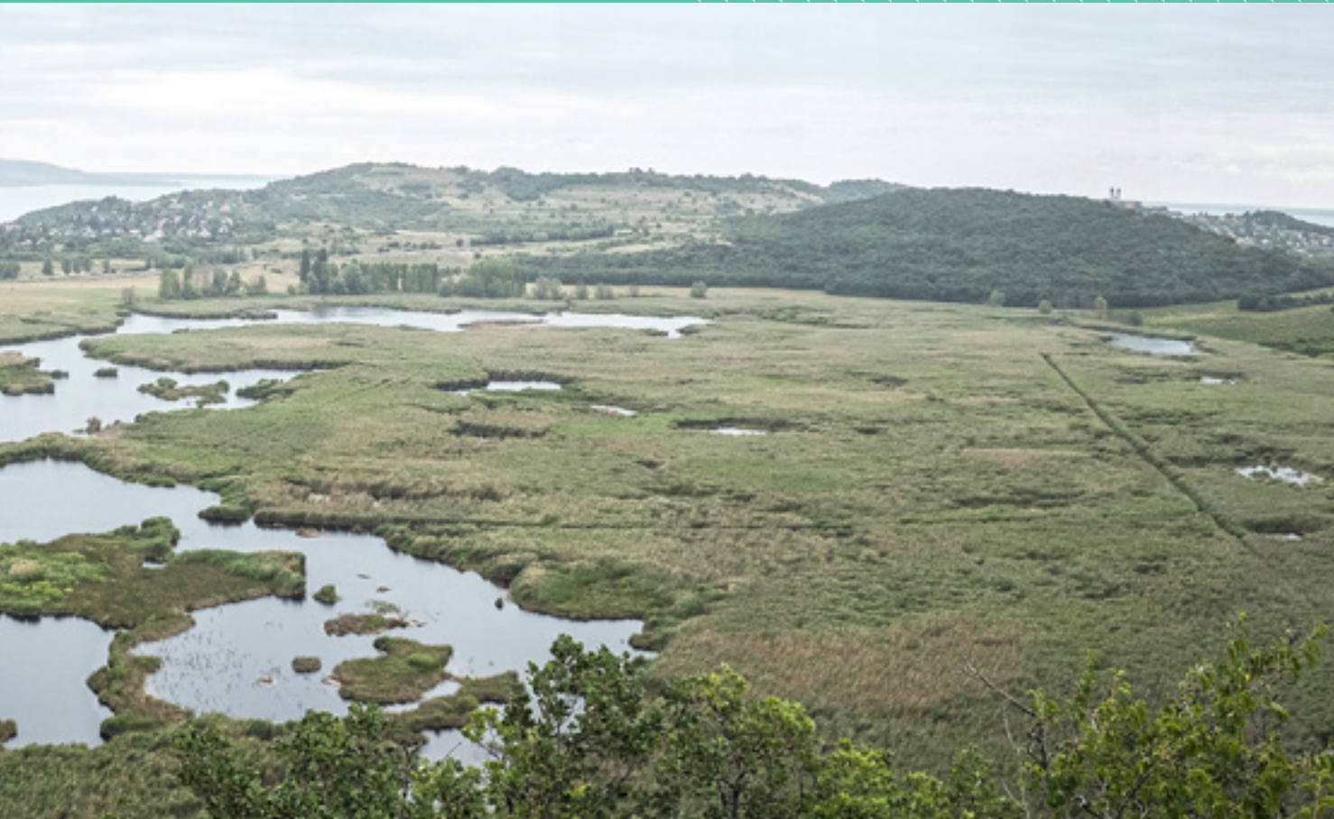
A Külső-tó, a Tihanyi Apátság, a Balaton és Balatonfüred látványa a Sajkodhoz közeli Örtrony kilátóból nézve