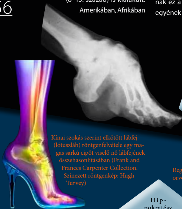
Kínai szokás szerint elkötött lábfej (lótusz láb) röntgenfelvétele egy magas sarkú cipőt viselő nő lábfejének összehasonlításában