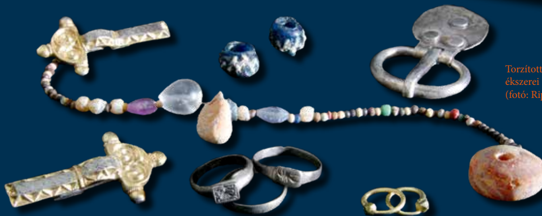
Torzított koponyájú lánygyermek ékszerei és ruharögzítői az 5. századból

kel. A közelmúltban viszont fény derült arra, hogy még az avar korban (a 6–8. század között) is jelen volt a szokás, noha ezt az új felfedezést egyelőre kevés, kizárólag a Tiszántúlról származó eset támasztja csak alá.