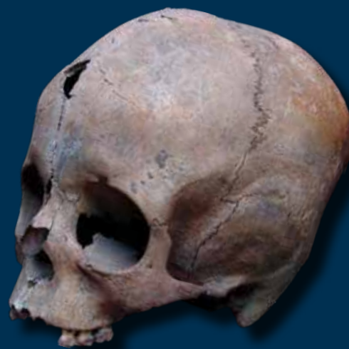
Kora avar kori gepida (?) gyermek torzított koponyája a Dél-Alföldről