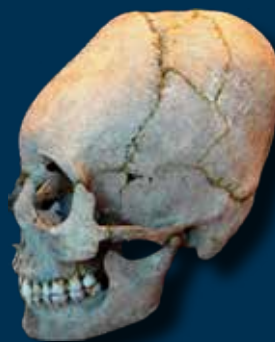
A népvándorlás kori Kárpát-medencében jellemző, bandázzsal történő kettős fronto-occipitalis (homlok–nyakszirti) torzítás rekonstrukciója (Bernert Zsolt)

Az 5. századi Dunántúlon a legtöbb torzított koponyájú egyén úgynevezett juvenilis (15–23 év) és adultus (23–40 év), az 5–6. századi Alföldön nagyrészt adultus, többen maturus (40–60 év), páran pedig senilis (60 év felettiek) életkorban hunytak el. Következésképpen az Alföldön letelepedett életmódot folytató gepidák, s közülük is a torzított koponyájúak nagy része megérte a felnőttkort. A gyermekkori elhalálozás az alföldi torzított koponyájúak körében nem volt tehát olyan kiugróan magas.