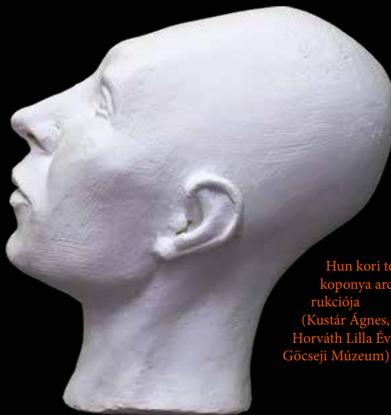
Hun kori torzított koponya arckonstrukciója (Kustár Ágnes, fotó: Horváth Lilla Éva, Göcseji Múzeum)