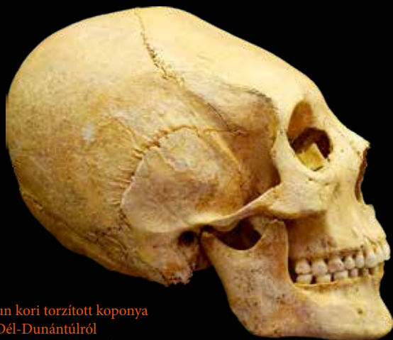
Hun kori torzított koponya a Dél-Dunántúlról