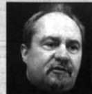
Dr. Iplikovich György polgármester: „Az az igazság, hogy meg vagyok hatódva”