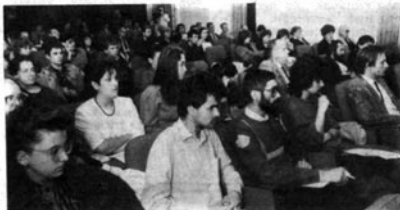
A köznység — ma még színház nélkül.

Az alapszabály vitája, épp a fenti okok miatt lapzártaikor még tartott. Ezt az elnök és a vezető testületék megválasztása követte. Erőri később tájékoztatjuk olvasóinkat. T. K.