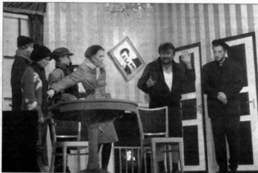
Dürrenmatt: A fizikusok. Tavasszi premier a felújítatlan Kisfaludy utca 1-ben

Emlékeztetőül: a 2000-ben megalapított Szombathelyi Színházbarátok Egyesülete – a Pincészinház – három sikeres előadást hozott létre a városban az elmúlt években, különböző helyszíneken: színházban csináltak, nem színházi körülmények között. ( Székely, szállószőlő, 2001: Klejman és a halál, 2002: A fizikusok, 2004 ) Tavasszal újabb bemutató készül – többrendbeli városi támogatással, sikeres pályázatok nyomán –, az előadás rendezője a fiatal rendezőnemdék egyik legte-