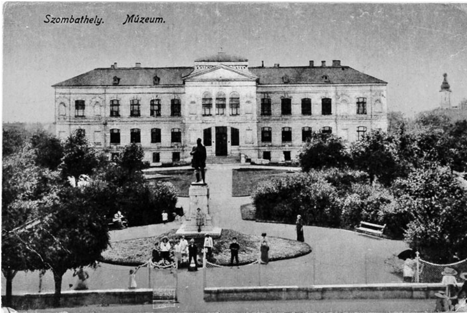
Múzeum, 1920-as évek