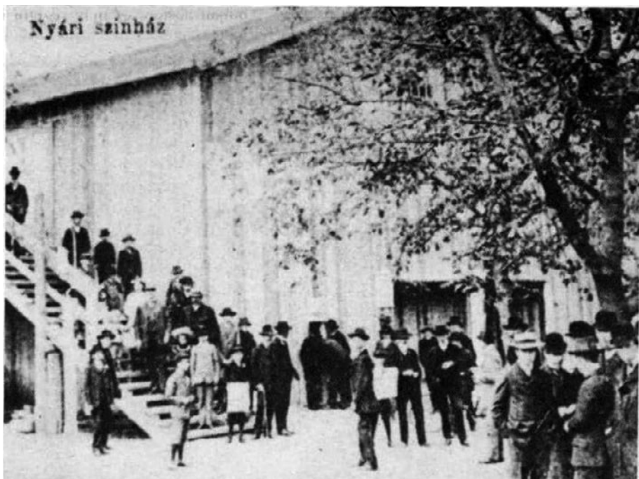
A Nadasdy-féle nyári színház Vas Népe 1991. június 21. 5. o.