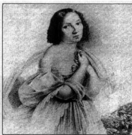
A vándorszínészet primadonnája, Déryné Széppataki Róza is járt Szombathelyen