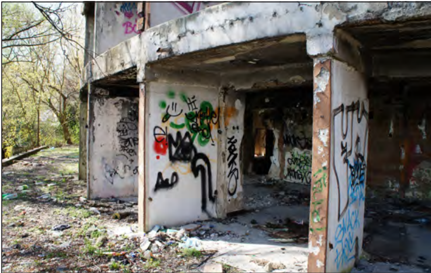
Az egykori „Sajtház” 2017-ben

ni nekik arra, hogy a gyarapodó árvizeket biztonsággal levezessék.