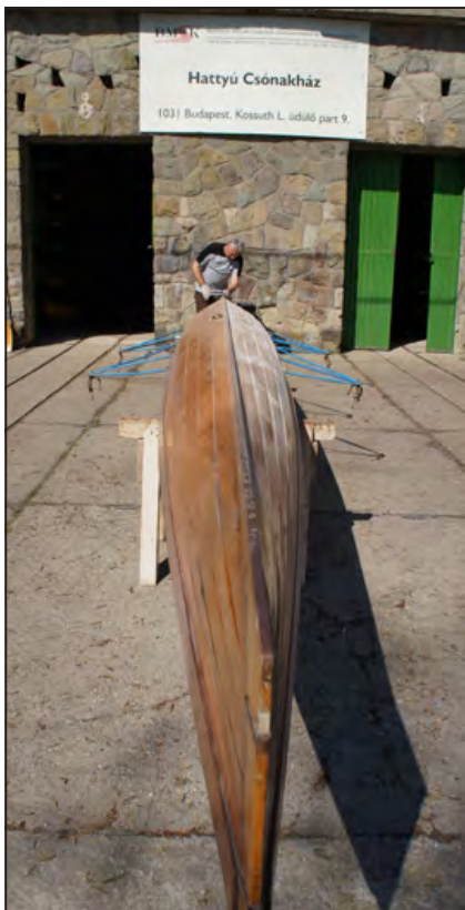
Ráfér a karbantartás

Történelmi tanulmányainkból tudhatjuk, hogy a Senātus Populusque Rōmānus (S.P.Q.R.) a római szenátus és a római nép teljes jogegyenlőségét jelző felirat. Ami a plebejusok „polgárjogi” harcának gyümölcse volt: a lakóhely szerinti népgyűlés (Comitia Tributa) kivívta magának a jogot arra, hogy bizonyos döntéseket maga hozzon meg. Különös véletlen, hogy éppen az egykori aquincumi polgárváros melletti „szent ligetek” esetében kell, egészen pontosan 2304 évvel e társadalmi vívmány keletkezése után, ennek jelentőségéről megemlékeznünk. A Római-part sorsa ugyanis most éppen azon múlik, hogy a „szenátus” (nevezzük ezt most fővárosi közgyűlésnek) mennyire képes meghallani a plebsz (nevezzük most őket érintett állampolgároknak) szavát.