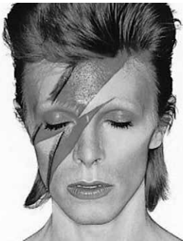
David Bowie mint Ziggy Stardust

úr-motívumokat, s önkifejezésének szerves részévé teszi azokat. Komplet szimbólum-rendszert épített erre a témára, amely végigkísérte egész életét. Nem esett túlzásokba, hiszen, bár a hetvenes évek első felében külsőségeiben is gyakran alkalmazott futurisztikus jelmezeket és sminket, mindezt alárendelte a dalai mondanivalójának. Azután, ahogy időződött, a külsőségek fokozatosan mély- és sokértelmű szimbólumokká lettek dalaiban, visszafogottabban, de gondolatilag erőteljesebben mutatkoztak meg.