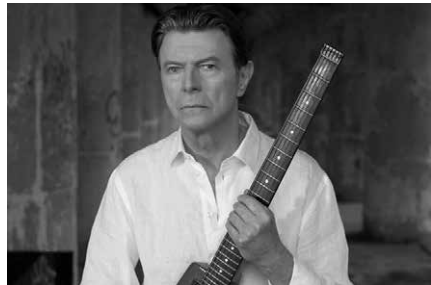
Bowie 2013-ban, a Valentine's Day c. klipben

Chris Hadfield kanadai űrhajós 2013 májusában, alig pár nappal a Földre visszatérése előtt elkészíti a Space Oddity változatát az ISS fedélzetén. Kissé átírja a dal szövegét, idomulva az ISS-ről hazainduláshoz „zárd be a Szozuz zsilipjét” vagy „nem maradt hátra több tennivaló”. A dalt Bowie-val kötött egyezés alapján hozta Hadfield nyilvánosságra, eredetileg egy évre szóló szerződésűk volt, ám az űrhajós nagy sikerére való tekin-