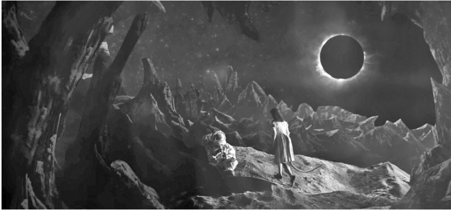
„Major Tom halott, Bowie él” – így üdvözölte a The Telegraph a Black Star c. dalt a múlt év októberében