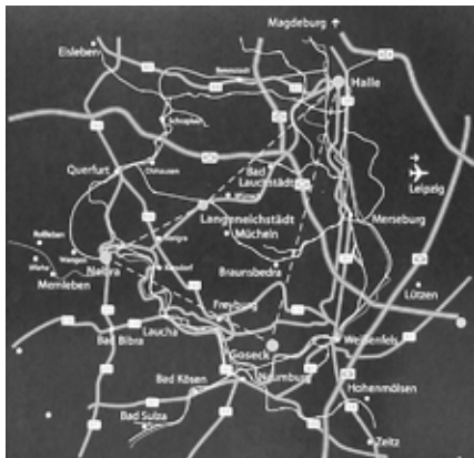
A Himmelswege útvonala

Sok helyütt találkoztunk ebben a városban elhanyagolt, néhol romos műemlékekkel, a keletnémet múlt árnyékaival. Első sétánk onnan mális csillagászati emlékebe ütköztünk: a város címerében a holdsarló mellett két csillag (az egyik a Vénusz) látható.