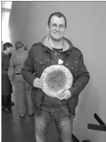
A szerző a nebrai korong 1:1 arányú másolatával az Arche Nebra kiállításán

A kiállítóhelyen minden hónapban 2-3 napon programok is vannak, egyrészt tematikus esték, amelyeken az adott (régészeti, történelmi, csillagászati, stb.) téma elismert kutatói adnak elő a mélyebb szintű ismeretek befogadására nyitott közönségnek, másrészt családi napok, amikor interaktív játszóházak működnek. Ezekon kívül több alkalommal tartanak távcsöves bemutatásokat a Napról és az éjszakai égboltról is. A nyári napforduló nap-