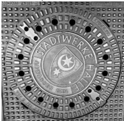
Halle címere – a holdsarló két csillaggal – még az aknafedőkön is feltűnik

azonban nem csak a legújabb idők hozadéka, a város neve azt mutatja, hogy a régi időkben lakosai sókitermeléssel foglalkoztak. Erre utal a Saale folyónév is.