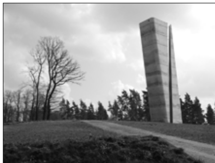
Vigyázat, dől: a nebrai Mittelberg dombtetőn található kilátótoronny

A planetáriumi előadás nagyjából azt mutatja be, amit a kiállításon is megtudtunk, de itt a fő hangsúly a csillagászati tudnivalókon volt. Maga a planetárium-helyiség döntött kupolás, így a nézőknek nem kell teljesen hátradőlniük a látvány befogadásához. Kényelmes székekben, kissé hátradőlve, ráadásul angol nyelvű alámondással élvezhettük a műsort.