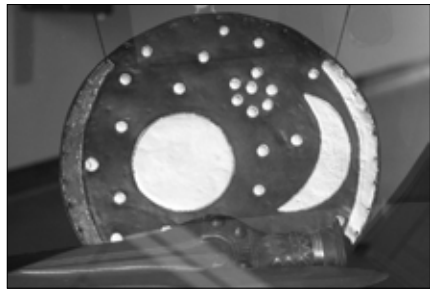
A nebrai korong kétszeres méretű másolata az Arche Nebra kiállításán

mellett álló Hold alakját a korongon látható-éval. Amennyiben az újhold még messze volt a Plejádoktól, és csak a néhány napos dagadó holdsarló jelent meg mellette, szükség volt a korrekcióra. Épp ez a dagadó holdsarló van ábrázolva a korongon. A holdév és a napév eltérése három esztendő alatt 33 napot tesz ki, de az újhold első fénye csak a második napon látszik, így az év utolsó holdhónapjának újholdjától éppen 32 nap telik el, míg a Plejádok mellé ér a Hold – ez a szabály megismétlése. Tehát foglaljuk össze röviden: a naptárkorong, Hansen szerint, a következő utasítást tartalmazza: Ha az év (holdév) első hónapjának (tavasz) első napján, az újhold sarlója nem a Plejádok mellett látszik, és csak a korongon látható dagadó alakban mutatkozik mellette pár nap múlva, akkor egy plusz hónapot kell beiktatni, és csak a következő újholdkor kezdődik az új év és a tavasz. A csillagok száma megismétli ezt a szabályt: a korrigálandó évben, a tavasz hót megelőző (12.) holdhónap újholdjának megpillantásától ennyi nap telik el addig, míg a Plejádok mellé ér a Hold.