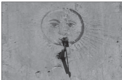
A Szindbád című filmben látható napóra

gadjuk a varázslatot. És nem is mindig sikerül. Néha megrémít, mennyi mindent tud a nőkről (valószínűleg: mindent). Mennyi mindent tud Magyarországról, arról a szép, régi Magyarországról, ami már akkor is viszszavonhatatlanul elmúlt, amikor az író fiatalon a robbanásszerűen kiépülő, dinamikus, pezsgő Budapestre került.