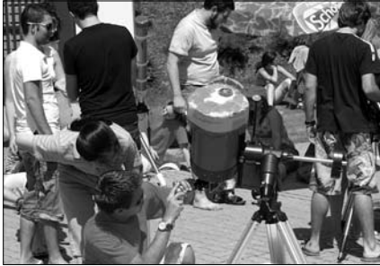
Az augusztus 1-jei napfogyatkozás észleli

jelenségre mi is felkeltünk reggel kilenc felé. Így alkalmunk volt belenézni néhány távcsőbe és binokulárba, melyek végét gondosan lefedték fóliával.