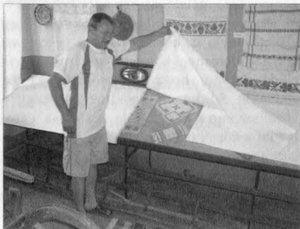
A szövőszakkör munkái

A líceumnak múzeuma is van, ahol összegyűjtötték a környék padlásairól a régiségeket, és kiállították azokat, megőrizvén az utókornak. Igen érdekesek a hajdani egyszerű, ám nagyszerű használati eszközök. A fizika szertárban megcsodálhattam a valamikor jobb időket megélt refraktort, amit anno még a kommunizmusban kapott a líceum. Sajnos mára már a gondos ápolásnak köszönhetően (nagyon karcos az objektív) használhatatlanná vált a 60/1000-es refraktor, és a több évtizedes használat során a tartozékoknak is nyoma veszett. Több szakkör is működik a líceumban, említésre méltó a kerékpáros akrobata csoport, amely már nemzetközi hírű, és a beregszászi népi motívumokat, hagyományokat őrző szövőszakkör, ahol a lányok a