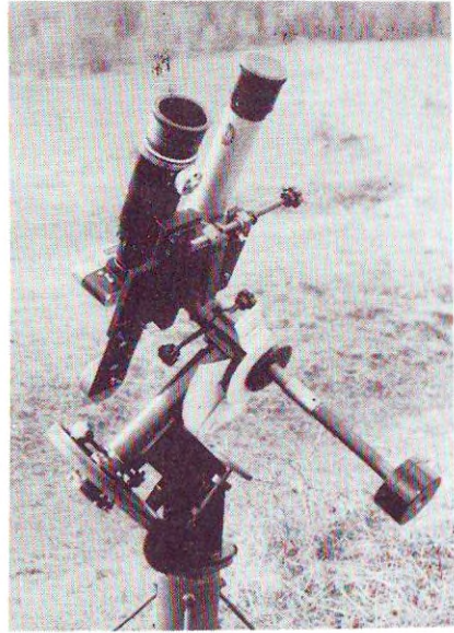
Sigmund Tamás (Kolozsvár, Románia) asztrofotós mechanikája: 4,5/300-as tele + 50/500-as vezető