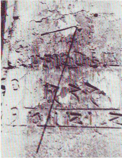
A tövisi (Románia) középkori napóra