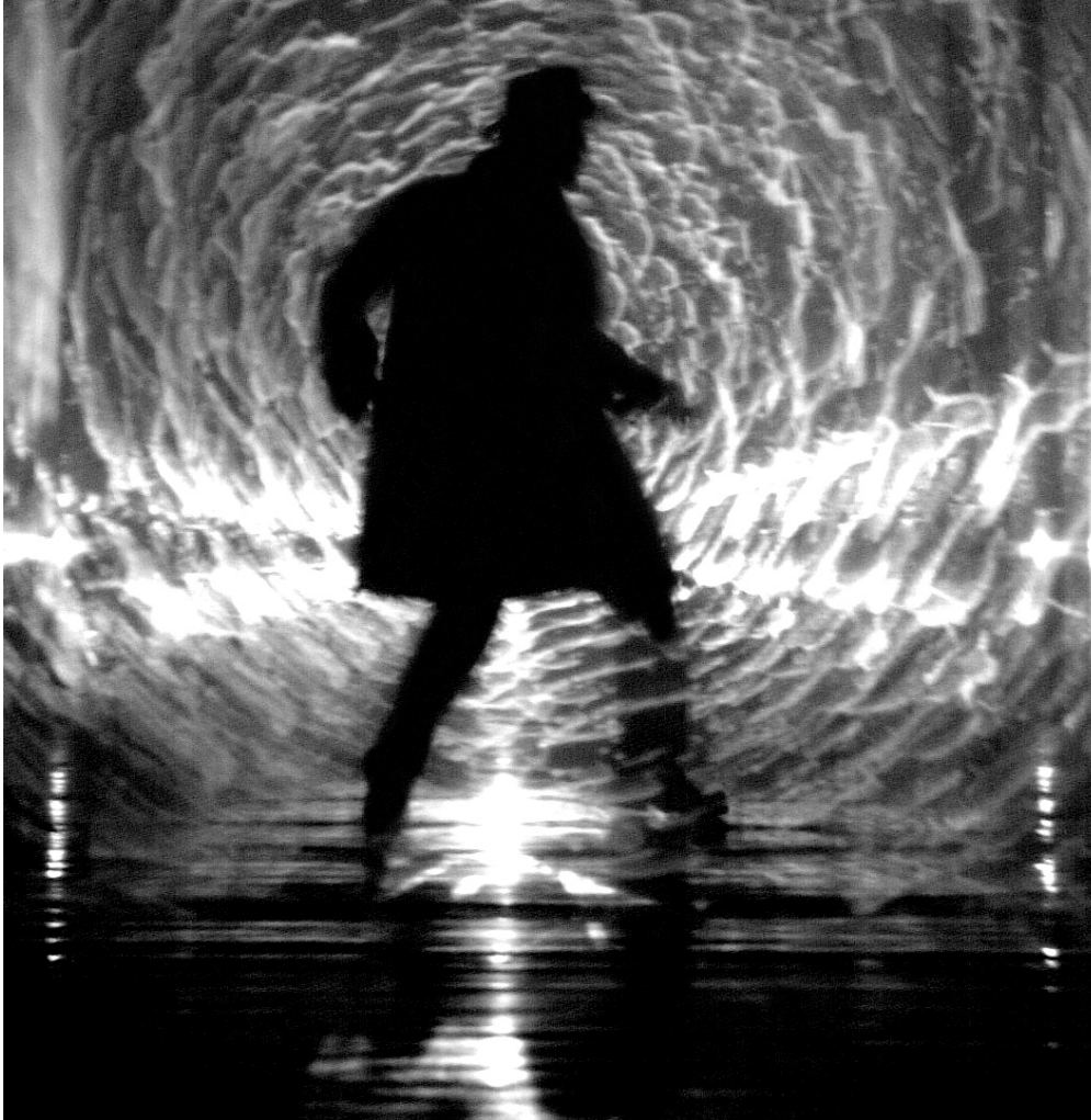
Barakonyi Szabolcs felvételei

(Kérem, most ne mondják, hogy a cikk szerzője meghibbant, hogy merészel ilyenmit még csak ki is ejteni a száján. Még hogy a Trafóban eldurant előadásról valaki ilyet mond, hát ez már a provincializmus teteje vagy legalja, az előbb még a