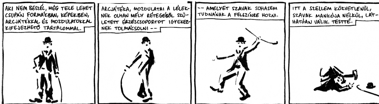
KONCEPCIÓ: HUDRA MÓNI • RAJZ: ORAVECZ GERGŐ