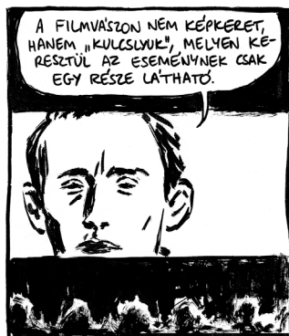
KONCEPCIÓ: HUDRA MÓNI • RAJZ: ORAVECZ GERGŐ