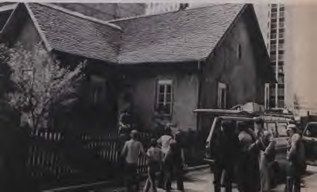
Vatroslav Mimica: Felhő utolsó küldetése

szokványos partizánfilmek száma is csökkent, s ebben a műfajban is újítani tudtak a fiatalok. A nagydíjas Jordan Zafaranović Megszállás 26 képben című munkája, ha tetszik, partizánfilm: 1940—41, Dubrovnik, fasiszta megszállás, szerveződő ellenállás, akció, megtorlás. A fiatal rendező valójában a horvát történelem igencsak érzékeny pontjára tapintott rá. A németek, majd olaszok által megszállt Dubrovnikban ugyanis a megszállók egyetlen csepp vért sem ontottak. A szörnyű mérszárlásokat a hazai fasiszták követték el, dubrovnikiak gyilkoltak dubrovnikiakat. A horvát „meleg napok” tör-