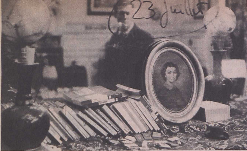
Kép a »Lidércfény«-ből

— Amikor Drieu La Rochelle regénye a kezembe került, éppen egy hasonló problematikájú forgatókönyvön dolgoztam, »Ma este harminc éves« címmel. Azt hiszem ezen a válságon többé kevésbé minden érzékenyebb intellektuel keresztül megy, de az élet természetes rendje az, hogy ezen a válságon átláboljunk. A határvonalon innen még elegendő volt a lehetőségeket csillogtatni, belőlük élni, de ezen túl már bizonyítani kell. A film Alain-jének tragédiája az, hogy a célokat, melyek barátai életét kitöltik, nem tudja, vagy nem akarja elfogadni. »Iszonyodom a középszerűségtől« — mondja. S ezért nem csinál semmit. Ő, aki valaha tizenhét éves korában gyalog elment Spanyolországba, hogy Franco rendszerét megdöntse, ma semmi célját nem látja életének. Azokat, akik az OAS régen elvesztett harcát folytatják, groteszknak és ostobának találja. Az éjszakai élet örömeitől megcsömörlött. A parazita létezését nem akarja vállalni. Az igazi szerelmet nem leli meg. »És a szépei: Dorothy, Lydia és a többiek? Ragyogóak és imádják magát« — mondja egy barátnője. »Nem elég szépek. Nem elég jók... Elmentek.«