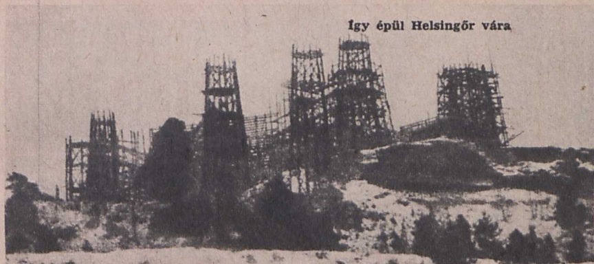
Igy épül Helsingör vára