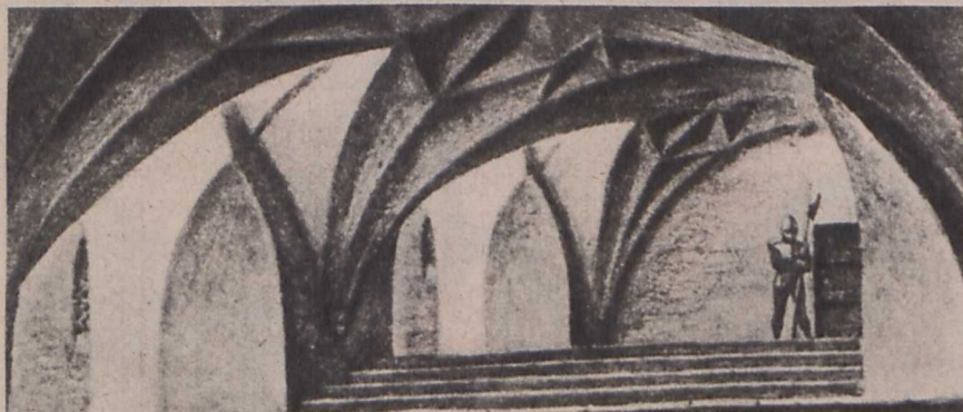
Folyosórészlet a dán királyi várkastélyból