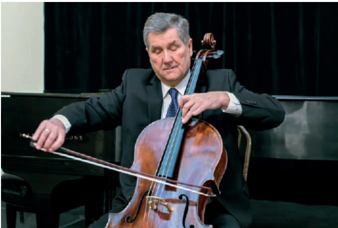
Chicagóban Kodály műveit mutattam be

Kodály műveinek rendszeres előadása fontos szerepet kap műsoraim szerkesztésében. Ha tehetem mindig szerepel szólóestjeimen Kodály-mű különösen külföldön. A Szólószonátát több, mint százszor játszottam Budapesttől Marosvásárhelyen keresztül Buenos Airesig. Először 1967-ben Debrecenben, utoljára pedig 2019. márciusában Chicagóban. A Duót például egyik amerikai turnémon 18 alkalommal adtam elő. 1985–90 között a bostoni Kodály Center of America állandó meghívottjaként mesterkurzusokat tartottam és Kodály műveit mutattam be az Egyesült Államokban.