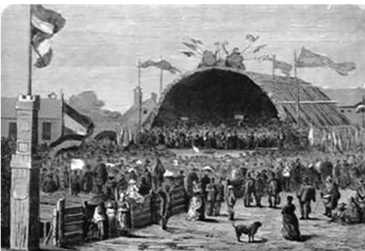
A debreceni Dalcsarnok

A program már a jól bevált módon zajlott le: fogadás a pályaudvaron, a kórusok bevonulása a városba, a kóruszászlók elhelyezése a Városházán, ünnepi mise, közös próbák, hangversenyek. Verseny (feszültség a bírálatok miatt, kevés zenész volt a zsűriben). Ünnepi közgyűlés.