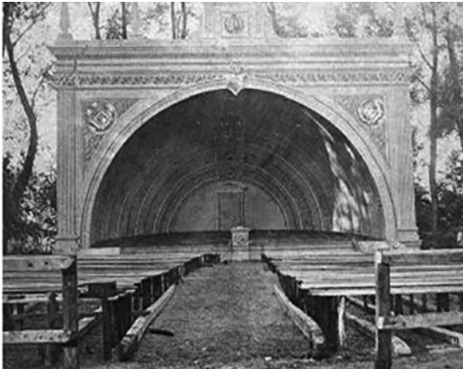
Az aradi Dalcsarnok