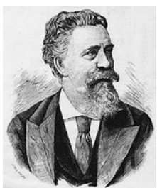
Huber (Hubay) Károly (1821 Varjas – 1885 Budapest)

Idézet: Kodály Zoltán Az új egyetemes népdalgyűjtemény tervezetéről tartott felszólalásában (1913)