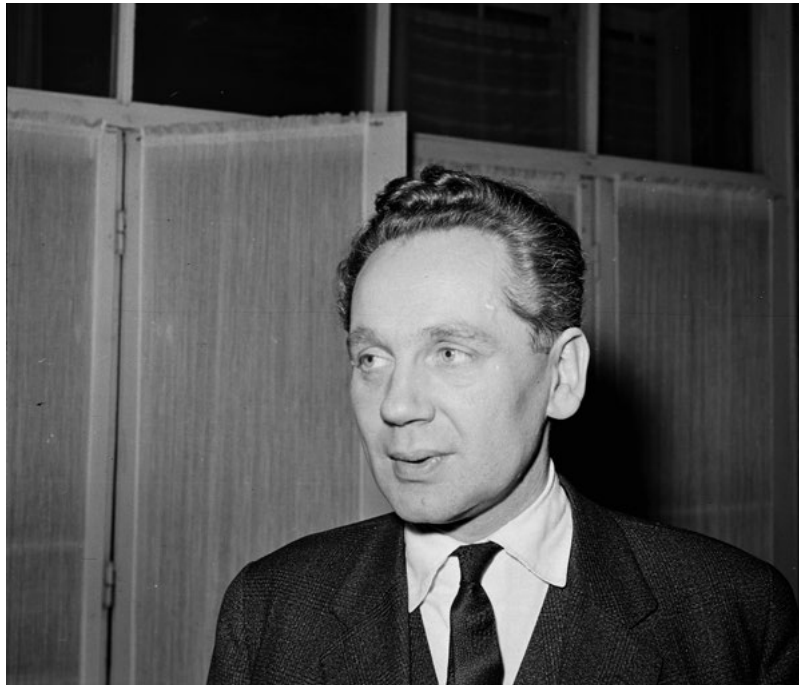
„Az íróársadalomnak olyan típusú tisztviselőket kéne kapnia, mint például Hubay Miklós...”. Hubay Miklós, az Írószövetség 1981 és 1986 közötti elnöke 1965-ben, a Szövetség Bajza utcai székházában.

A Közgyűlésen olyan eszmecsere legyen, ahol a négyszemközti beszéd kölcsönös bizalma érvényesüljön, senkibe se fojtsák bele a szót, gyanakvás, vagy előítélet folytán.