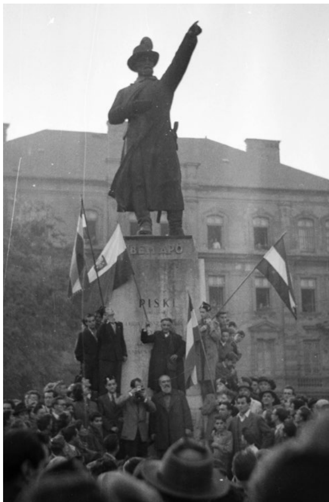
Tüntető a Bem-szobornál.

Végre megérkeztünk a Bem-szoborhoz, illetve odajutottak azok a szerencsések, akik a sorban elől voltak. Hogy lássak valamit, két barátommal előre tolakodtam. Megszámlálhatatlan sokaságú tömeg szorongott a téren. Nagy taps közepette körülhordozták a téren a lyukas zászlót, majd pedig a Kossuth-címet a lengyel címer mellé helyezték. Ekkor a tömeg a lengyel-magyar barátságot élte, és elénekelték a Himnusz t. Egy, a közelünkben álló teherautót annyira elleptek az emberek a jobb kilátás érdekében, hogy komolyan aggódni kezdtünk a kocsi és a rajta lévő emberek