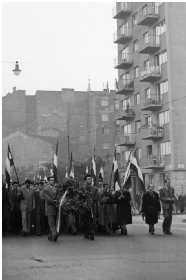
Műegyetemisták felvonulása a Bem tér felé, 1956. október 23-án.

Eközben más egyetemekről való diákok is megjelentek, és az esti képzésen tanuló egyetemi hallgatók is szép számban gyülekeztek. Utóbbiak egy képviselője lépett a mikrofonhoz, és nemcsak az estiek, de az üzemek munkásai nevében is támogatásáról biztosított bennünket. Durva és éles arcvonású középkorú férfi, kifejezetten forradalmár típus volt a felszólaló, és amit ezután mondott, az minden eddigi képzeletet felülmúlt. Részletesen beszámolt a lengyel eseményekről, és kifejtette, hogy a Kossuth adó eltitkolja az igazságot, vagy tudatosan elferdíti azt. A bejelentést tomboló tapsvihar fogadta. Azután elképesztő nyíltsággal számolt be a szovjet csapatmozgásokról, a lengyel hadsereg összevonásáról, Hruscsovék varsói útjáról és annak kudarcáról, Rokossowski és a többi sztálinista eltávolításáról a Politbúróból stb. 7 A tömeg hangulata érezhetően szinte a végletekig felszökött. Füttykoncert és szovjetellenes tüntetés volt a válasz az elhangzottakra, és pedig olyan kéjjel, amilyen nagy örömet csak az jelenthet, ha valami olyasmit teszünk, amit nem szabad. Egy láthatóan egyszerű családból származó hadmérnök hallgató csodálkozva jegyezte meg mellettem: „Hát ezt bizony nem is gondoltam volna”. Olyan embernek