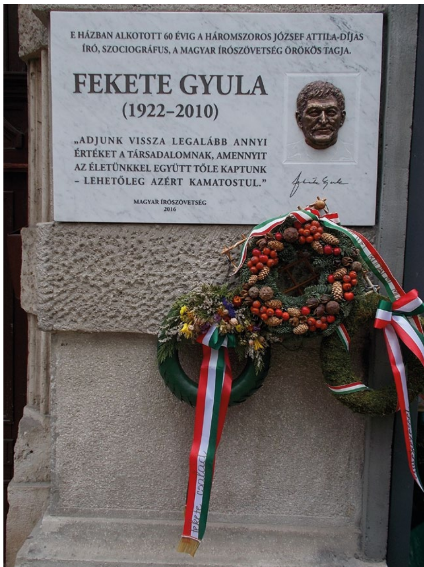
Fekete Gyula 2016-ban avatott emléktáblája a budapesti Kecskeméti utcában.

Fekete Gyula 2010. január 16-án hunyt el Budapesten. Jókai Anna 2012-ben, születésének 90. évfordulóján a Magyar Írószövetség által rendezett emlékestén így idézte fel az író alakját: „Leghíresebb regényét, Az orvos halálát tulajdonképpen saját halálával hitelesítette. Úgy ment el, hogy mindent megtett, hiszem azt, hogy gyógyított, de valójában a világ nem válaszolt neki.” 43 Hogy Fekete Gyula gyógyított, nem vitás, azt, hogy a világ milyen mértékben reflektált erre, már nehezebb megválaszolni. A magyar társadalom egyes szerveződései mindenképpen ismerik, elismerik munkásságát, érdemeit, mindazt, amit 1956-ban a nemzeti szabadságért, később a magyarság demográfiai állapotáért aggódva, vagy éppen a rendszerváltáshoz vezető úton megcselekedett. A magyar társadalom válaszána elégségessége ugyanakkor kérdéses és megfontolásra érdemes. Különösen akkor, amikor a nemzet népesedési ügyei újfent (aktualitását tulajdonképpen sosem veszve) a közbeszéd előterébe kerültek, amikor közeledünk az 1956-os forradalom és szabadságharc hatvanötödik és Fekete Gyula születésének századik évfordulója felé.