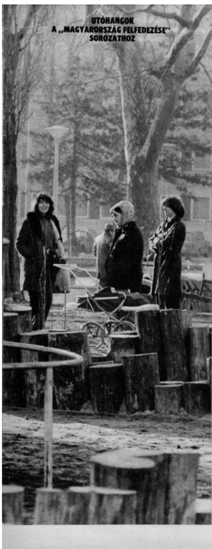
UTÓHANGOK A „MAGYARORSZÁG FELFEDEZÉSE” SOROZATHOZ

A hetvenes évek elején a Nők Lapja is indított egy sorozatot a népesedés kérdéskörének vizsgálására. Széles körű vita volt ez – ezúttal elsősorban „laikusok” között. Az újság számos olvasói levelet jelentetett meg. Amíg korábban a problémát elsősorban értelmiségi szerzők boncolgatták, a Nők Lapján keresztül hangsúlyosabban nyílt meg a lehetőség a széles közvélemény számára, hogy hozzá- szóljon a vitához, kifejtse véleményét. Ebből a sorozatból állította össze Fekete Gyula 1972-ben az Éljünk magunknak? című szocio- gráfiát a Magyarország felfedezése sorozat részeként. 29 Több mint 700 levélíró véleményét válogatta, rendszerezte egy szervezető, vitázó, valamint egy statisztikai összefoglaló kíséretében. Ebben a népeség-növekedés visszaesésének okait két tényezőben látta és láttatta. Az egyik a gyermeknevelés anyagi feltételrendszerének hiányossága, a másik pedig a morális, eszmei zavarokban keresendő. Ahogy a kötet címvá- lasztása is sugallja, Fekete az utóbbiakat ezúttal is hangsúlyo- sabb problémának értékelte. A levélírói véleményeket is felhasználva ismételtén javaslatot tett egy arányos közteherviselés koncepciójának kidolgozására és bevezetésére. Ennek kiindu- lópontja, hogy az igen alacsony családi pótlék mellett a gyer- mekvállalás anyagi hátrányt jelent, amelyet annak emelé- sével a társadalomnak fel kellene számolnia, mivel a mai