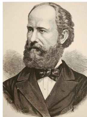
Than Károly (1834–1908)

Alapos előtanulmányai után 1860-ban a pesti egyetemen a kémiai tanszék helyettes tanára, 1862. július 18-án pedig a tanszék professzora lett. Ekkor lényeges követelmény volt a kiváló magyar nyelvtudás, mert addig a pesti egyetemen is németül folyt az oktatás. Than ettől kezdve a közoktatás, a közművelődés és a tudományos munkásság hazai felvirágoztatásának érdekében tevékenykedett. Tervei szerint új Kémiai Intézet épült, amely a Trefortkerten 1872-re készült el. Ez az épület ma is áll a Múzeum krt. 4/b alatt, a felújított épületben bölcsészkarai szakok működnek.