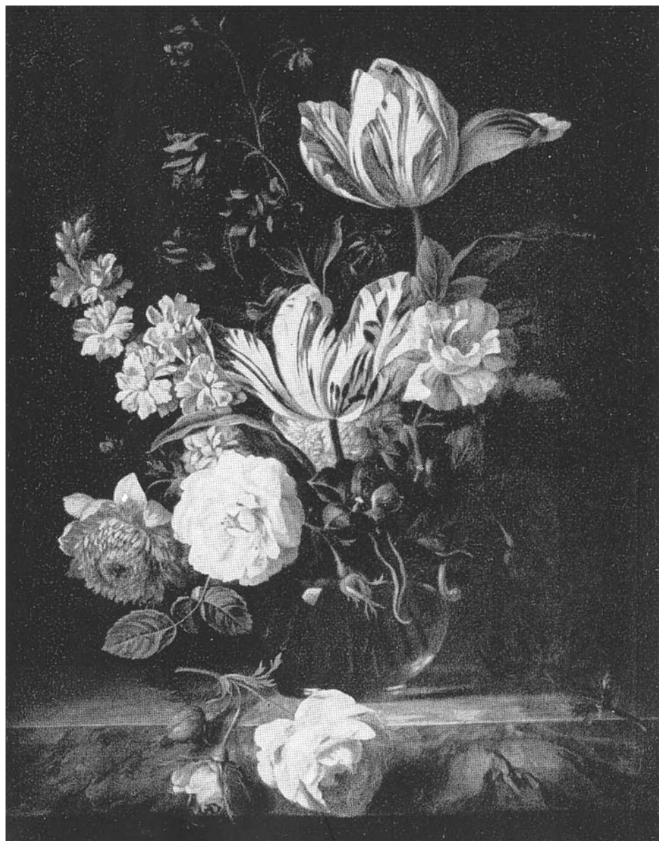
Bogdány Jakab: Virágcsendélet, Magyar Nemzeti Galéria, Nemes Marcell ajándéka 1908-ban a Szépművészeti Múzeumnak