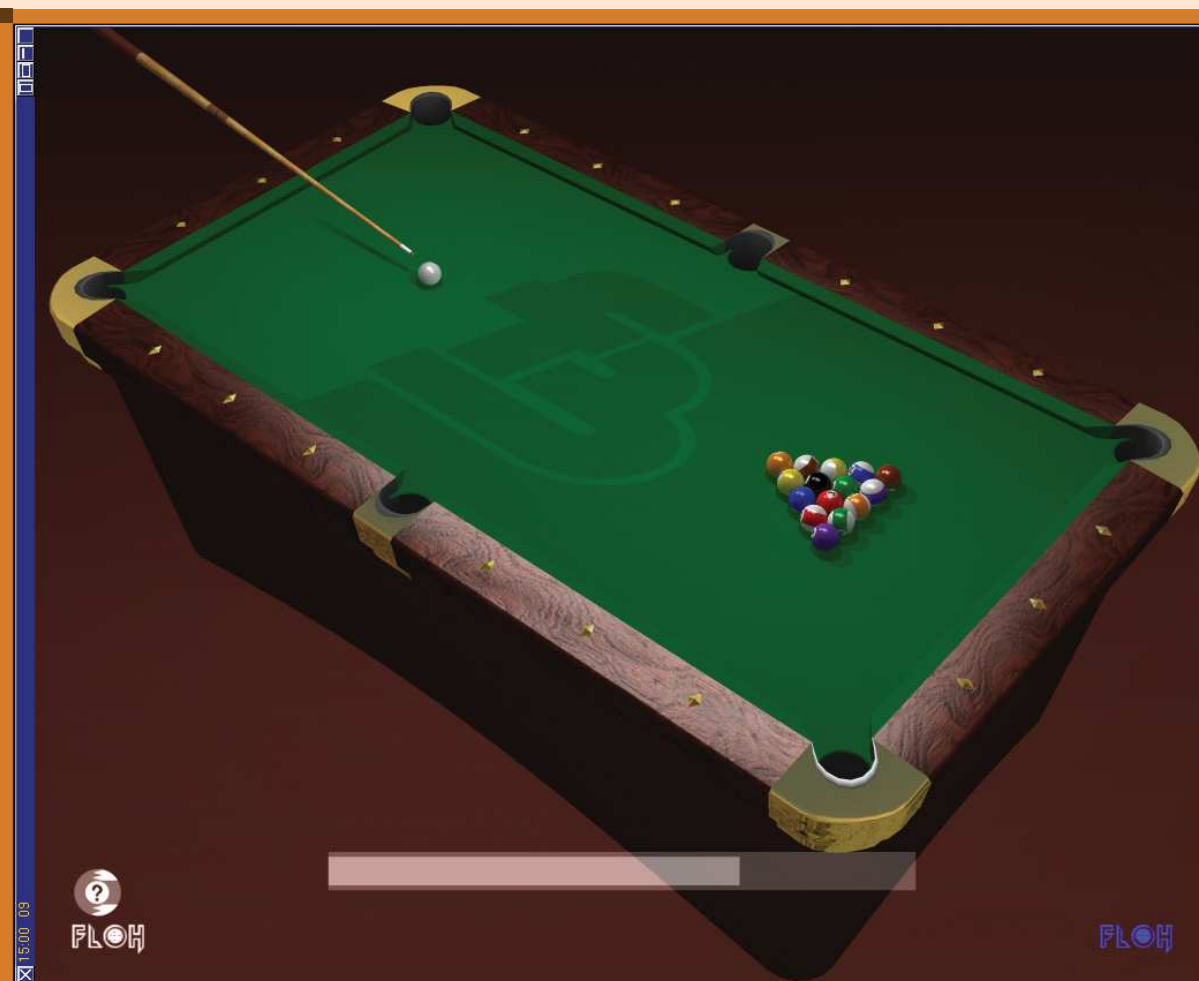
■ 1. ábra Az asztal

jegyzéseknek. 1868-ig elefántcsont golyókat használtak... Amúgy számos híresség és arisztokrata – például IX. Pius pápa és Viktória királynő – is biliárddal múltatta az idejét.