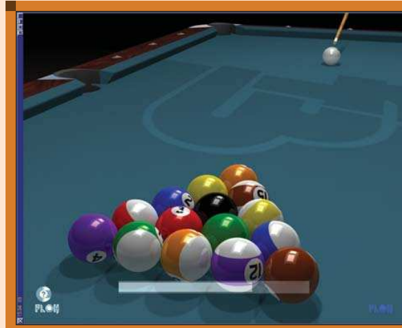
■ 3. ábra Indulhat a játszma