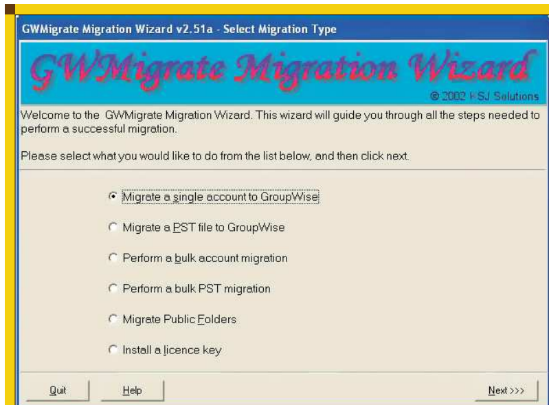
■ 2. ábra A GWMigrate egyszerre több migrációs munkaállomást is használhat, így az Exchange kiszolgálón tárolt fiókok, PST fájlok és nyilvános mappák tetszőleges kombinációját megadhatjuk neki forrásként. Természetesen akár egyetlen Exchange fiókot is átvihetünk vele GroupWise alá.

teszi lehetővé a valódi függetlenséget a felhasználók számára. Az Evolution e-mail kliens használatával a felhasználó teljesen függetlennek érezheti magát az informatikai felügyelet háttérrendszerétől. A SUSE LINUX használatának lehetőségével a felhasználók immár nincsenek egyetlen platformhoz kötve. A GroupWise 6.5 rendszert a Novell portolta Linuxra , így már három platformon kínál biztonságot és rugalmas háttérrendszert több konfiguráció támogatására egy szervezeten belül. Az eDirectory évek óta piacvezető a címtár és metacímtár rendszerek között, az utóbbi időkben a SUSE LINUX pedig az alacsony költségű és rugalmas asztali és szerver operációs rendszereket kereső szervezetek igényeit elégíti ki.