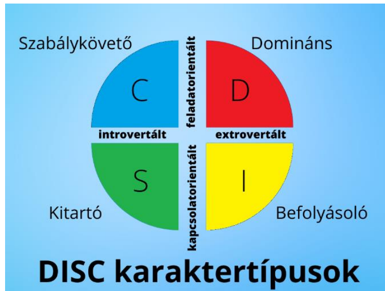
1. ábra: A DISC karaktertípusok leggyakoribb vizuális ábrázolástípusa