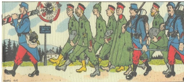
Abbildung 1: "Hansi"