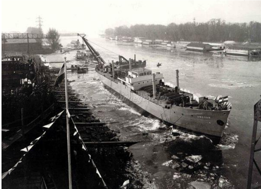
7. kép Ungvár hajó vízrebocsátása Újpesten a Ganz Hajógyárban.

Nem kétséges, hogy a sors gondolata választ kínál minden időregény alapkérdésére, amely minden élettörténet alapkérdése is egyben: nem lehet ugyan elbeszélni az időt, magát az időt, csak az időt önmagában véve, ámde nagyon is el lehet beszélni a sorssá szövődő időt. 47