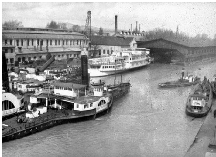
1. kép. Bátaszék, 1874-1944, DDSG Duna Gőzhajózási Társaság tulajdona.

1936 és 1945 között a magyar folyami áruszállítás forgalmának kb. kétharmadát adta a gabona és a liszt, a nyersolaj és származékai, az ásványok és ércek, a magyar olaj export. A lefelé szállított mennyiség csekély volt, főleg benzinből, petróleumból, tehát finomított termékekből állt. Ezek tranzit forgalma a háború közeledtével csökkent, Magyarország kőolajszármazék kivitele viszont 1939-ig dinamikusan növekedett. 24 A magyar belvízi áruforgalom hűen tükrözte az ország fokozódó gazdasági függését Németországtól. A más piacokra, a Dunán és a Tiszán lefelé szállított áruk mennyisége annyira elmaradt a fölfelé, Németországba szállított mennyiségtől, hogy azt ellensúlyozni már nem tudta. Az ország nem hadviselő helyzete azonban Jugoszlávia megtámadásáig mégis lehetővé tett némi manőverezést a Balkán felé. 25