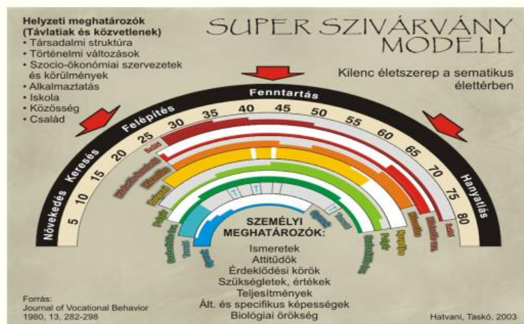
3. ábra Super modellje

A hiányalapú szükségletek teljesítése az ember fennmaradásának a feltételeit gyűjti csokorba, amelyeket a társadalom és a tér különféle ritmusban és időintervallumokban enged teljesülni. A növekedésalapú szükségletek a létfeltételeken túl mutató, a személyiség önmegvalósítása felé törekvő interakciós folyamatokat indítanak el. Az egyedfejlődés és identitás kialakulásának magyarázatához igen jól megfelel Super szivárvány-modellje, amely kilenc életszerepet-identitásvállalást jelez az életutunkban, amelyek a növekedés-keresés-felépítés-fenntartás-hanyatlás szakaszaiban eltérő erősséggel határozzák meg az „én”-azonosságunkat.