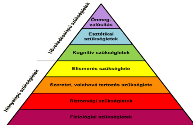
2. ábra Maslowi szükségleti rendszer piramisa

A hiányalapú szükségletek teljesítése az ember fennmaradásának a feltételeit gyűjti csokorba, amelyeket a társadalom és a tér különféle ritmusban és időintervallumokban enged teljesülni. A növekedésalapú szükségletek a létfeltételeken túl mutató, a személyiség önmegvalósítása felé törekvő interakciós folyamatokat indítanak el. Az egyedfejlődés és identitás kialakulásának magyarázatához igen jól megfelel Super szivárvány-modellje, amely kilenc életszerepet-identitásvállalást jelez az életutunkban, amelyek a növekedés-keresés-felépítés-fenntartás-hanyatlás szakaszaiban eltérő erősséggel határozzák meg az „én”-azonosságunkat.