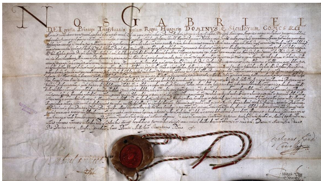
5. ábra Báthori Gábor fejedelem adománylevele

Bocskai István fejedelem 1605. december 12-én kelt kiváltságlevelében név szerint, 9254 hajdúvitézt kollektív nemesi joggal ruházott fel, s hét lakóhelyre – Szoboszló, Dorog, Nánás, Hadház, Kálló, Polgár, Vámospercs településekre telepítette őket. Kálló a Habsburg és katolikus hatalmi alközpont volt ekkor, s a jobbra kálvinista hajdúk gyakran kerültek konfliktushelyzetbe a királyi vár katonáival. A problémát feloldandó, Báthori Gábor fejedelem Váradon, 1609. szeptember 13-án újabb kiváltságlevelet adott ki, amelyben a kállói hajdúkat áttelepítette saját birtokára, amely négyszerese volt a kállói hajdú-javaknál, így negyvenezer hold birtokába jutotta