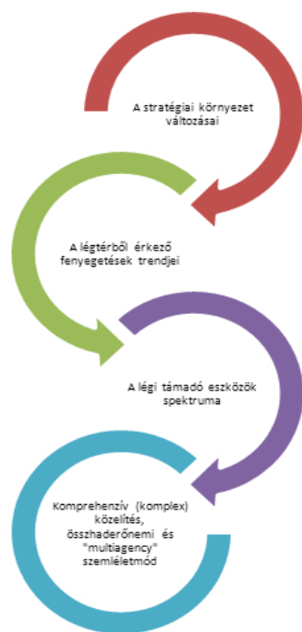
1. ábra. A légvédelem alkalmazási környezetének főbb determinánsai

Ez a komplex helyzet azt indukálta, hogy a biztonsági környezet jövőbeni leírásában, az esetlegesen bekövetkező alternatívák kidolgozásában a jövőkutatás klasszikus módszerei mellett, egyre újabb és újabb metódusokat 2 is alkalmazni kényszerülünk. A biztonságpolitikai jövőkutatás ( Future research in security policy, in warfare ), az elkövetkező háborúk formáinak, belső tartalmának előrejelzésében az Egyesült Államok kormányzati, és non-profit kutatóközpontjai („ think-tank ”-jai 3 ) állnak az élen. Bár történtek pozitív változások az e területen is tapasztalható amerikai szellemi dominancia ellensúlyozására, hiszen a közelmúltban felállított NATO Transzformációs Parancsnokság ( Allied Command Transformation ) keretében ún. Kiválósági Központokat ( Centres of Excellence 4 ) hoztak létre. E központok egyik főfeladata a Szövetség számára a jövőkép, a vízió biztosítása a megalapozott közép-, és hosszú távú tervezés céljából.