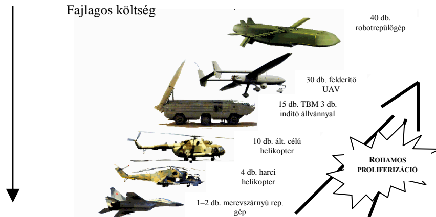
3. ábra. Növekvő fenyegetés, olcsóbb, tömegesebb légi támadó eszközök

Kevés szó esik manapság arról a biztonsági kockázatról, ami az ún. kézi (vállról indítható)