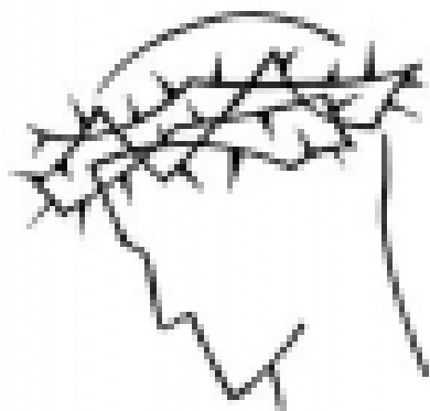
(Simon András grafikája)