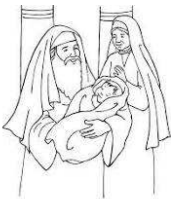
Simeon és Anna a Gyermekkel