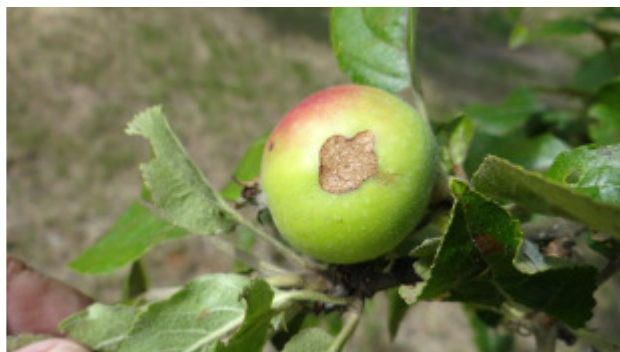
Húsvéti rozsmaringon a jég nyoma

A megye bogyós híréhez hűen csupán a ribiszke és málna biztat terméssel. Így aztán nem igazán lesz nagy gondunk ősszel a befőzéssel.