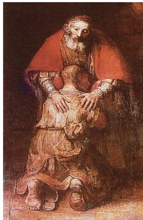
(Henri J. M. Nouwen: A tékozló fiú hazatérése)

„Gyakorta megkérdezem a barátaimat, mi az első benyomásuk Rembrandt Tékozló fiújáról. Egyöntetűen a bölcs öregemberre mutatnak, aki megbocsát fiának: a jóindulatú pátriárka. Minél tovább néztem a »patriárkát«, annál világosabbá vált számomra, hogy Rembrandt szándéka teljesen eltért attól, hogy Istent úgy ábrázolja, mint aki a bölcs, öreg családfő szerepében tetszeleg. Minden a kezekkel kezdődött. A két kéz meglehetősen különböző. Az apa bal keze, mellyel a fiú vállát érinti, erős és izmos. A széttárt ujjak befedik a tékozló fiú vállának és hátának egy nagy részét. Némi nyomást is érzek, különösen a hüvelykujjánál.