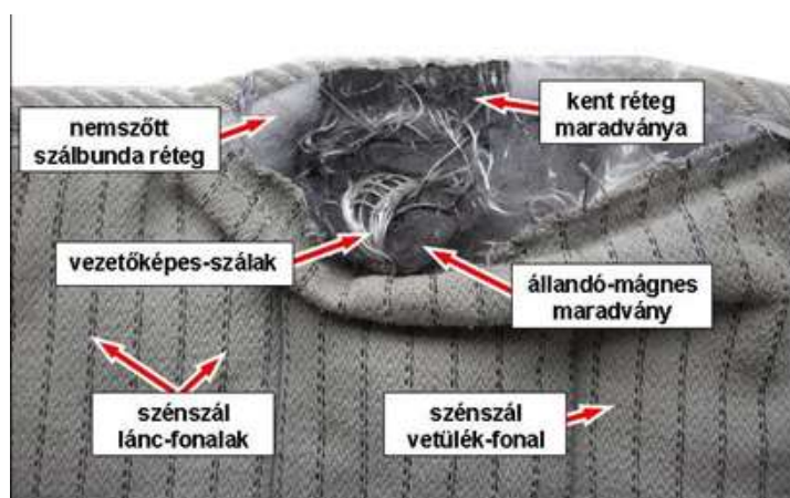
3. ábra A tisztítás után megbomlott biomagnetic derékalj részlete

Példaként egy ún. biomagnetic derékalj tisztítási károsodása után ismertté vált szerkezetében egyszerű, ill. több kérdést is felvető felépítés található (a tisztítás egyébként a bevarrt szalagcímke kezelési jelképei szerint történt, a termékszürkületést mágneses por kihullása okozta). Mindkét oldal szövött borítókelméjét egymást követő sávokban, két közeli fekete láncfonallal szőtték, bizonyos távolságokra pedig fekete vetülékfonalak vannak (a fekete fonalak valószínű szénzálból készültek). A cérnával letűzött termékben, a kazettaszerű sávokban több fóliatasak észlelhető, ezekben helyezhették el az állandó mágneseket, amelyeket vezetőképesszállakkal is rögzítettek, így a sávokon belül egymással kapcsolatban vannak. A laminált szerkezetben kenéssel felvitt fekete (műszaki célzatú) réteg és szálbunda-alapú nemszött kelme is helyet kapott. Megjegyzendő, hogy a káros elektrosztatikus kisülések elkerülésére alkalmazzák a vezetőképesszállak bekeverésével készült, ill. rácsszerű elosztásban vezetőképesszállak beszövésével előállított textíliákat. Így többek között ezek alkalmazása is kérdéses.