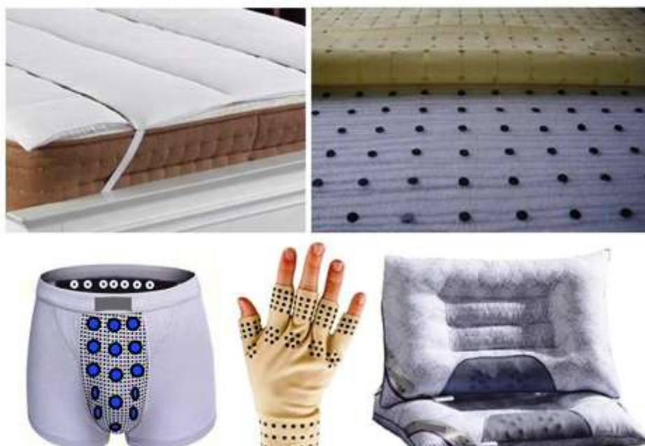
2. ábra Mágneses textiltermékek

Ugyanígy nem bizonyított az állandó mágnesekkel ellátott textiltermékek (pl. ágycetét, matrac, lepedő, derékalj, párna, alsónemű, kesztyű stb.) gyógyító hatása. Az ilyen mágnesekkel (akár port tartalmazó hajlékony szalag formájában) telepített, főleg fekvéssel kapcsolatos termékek sejt-anyagcserét serkentő tulajdonsága, értágító képessége, végtagok és visszeres elváltozások fájdalomcsökkentő hatása, neuralgikus fájdalmas és reumatikus kellemetlenségek enyhítése, migrénes állapot elhárítása stb. sajnos nem nyert tudományos bizonyítást.