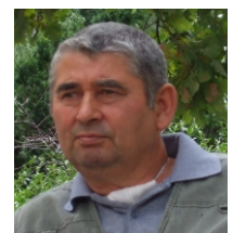
A gyászoló család

búcsúztatásán megjelentek és utolsó útjára elkísérték, sírjára virágot, koszorút helyeztek, részvétükkel fájdalmunkat enyhíteni igyekeztek. Külön köszönetünk a Viaelysium Kft. alkalmazottainak a temetés méltóságteljes lebonyolításáért.