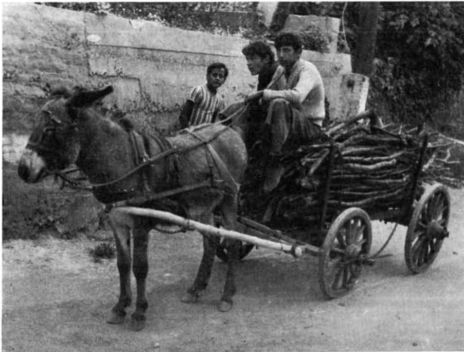
7. kép. Szamárfogat, Arló

A szamár fogatolásának elterjedt módja két állat befogása kisméretű, könnyű, gyakran gumikerekű kocsiba. A szekeret a gazdák nemegyszer maguk készítik el régi szekerek felhasználásával (5. kép). A répáshutaiak mindig maguk csinálták a szamárhoz kisméretű szekeret ( vozik ). Egy szamár esetén