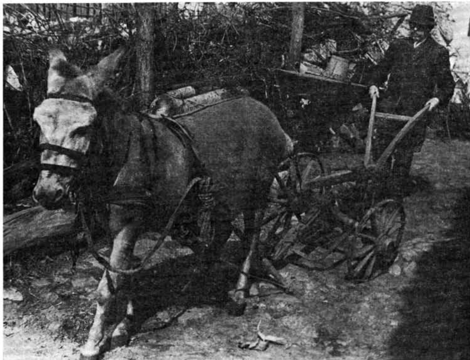
10. kép. Ekébe fogott szamár, Legyesbénye

Bükkszentkereszten, a századfordulót követő két évtizedben még általánosan szállították a meszet, de van rá adatunk Bükkzsércről és Kisgyőrből is. Egy-egy zsákba ( meh, vresco ) 2-3 véka meszet tettek, s a szamarat a hegyen áthajtva vitték árujukat. A legszegényebbek hordták így a meszet a közeli falvakba. A szamarak málházásának vizsgálata további fontos feladat lenne. Adataink azt mutatják, hogy ez a szállítási mód mégis inkább a magasabb, hegyi területekhez kapcsolódhatott. 23