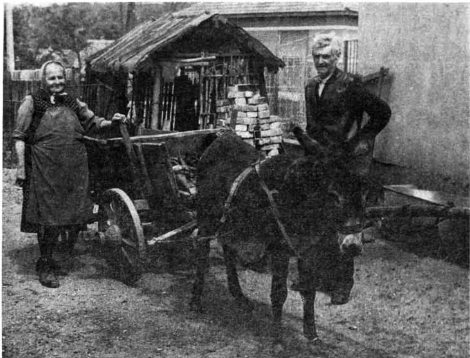
5. kép. Szamárfogat, Pere