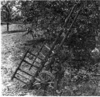
3 kép. Régí számartalyiga, Pere