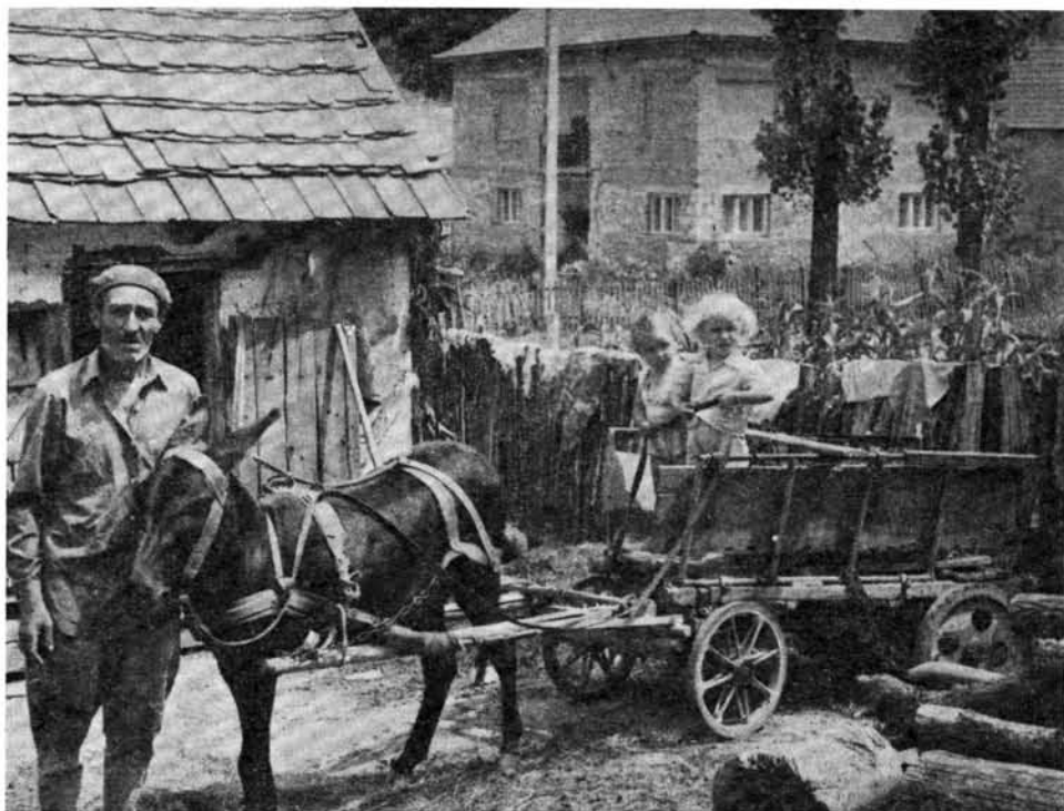
6. kép. Szamárfogat, Domaháza

patkószögekkel maguk ütötték fel a vasat az állat lábára. A szamarakat azonban általában a helyi kovács vasalta be . A szamár patkolásának díja fele volt a lóénak. Hasonló formájú, de kis méretű patkót használtak a szamarakra is, mint a lovakra. Gyógypatkót szamárira nem ütöttek, viszont használtak néhány kapaszkodó szeggel ellátott téli patkót .