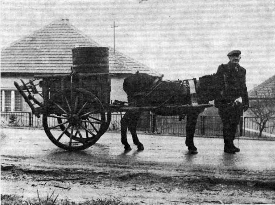
1. kép. Szamárfogat, Emőd

parasztgazdaságok üzemszervezetében a szamárnak nem volt helye, a legszegényebbek azonban még az eke és a borona elé is befogták. Azokban a falvakban, ahol sok szamár volt, bár lenézték, de személy szerint nem csúfolták a szamártartókat. Ahol azonban kevés volt a szamár, ott a tartó szinte mindig megkapta neve elé a szamaras , csacsis jelzőt. A szamarasok persze igyekeztek meg is indokolni állatuk tartását. „Nem a szamár szamár , hanem, az aki a hátán hordja a fát az erdőről!” — mondta egy 75 éves perei adatközlő. Nehéz szociális helyzet idején enyhül a szamarasok megszólása, amint azonban elmúlik a tartását elősegítő kényszer, ismét erőteljesebben jelentkezik. Manapság a háztáji gazdaságok mellett ideálisnak tartják a szamár tartását, s a vagyoni különbségek lényeges egyszerűsödésével már csak csipkelődéssé, élcelődéssé vált a szamarasok megszólása.