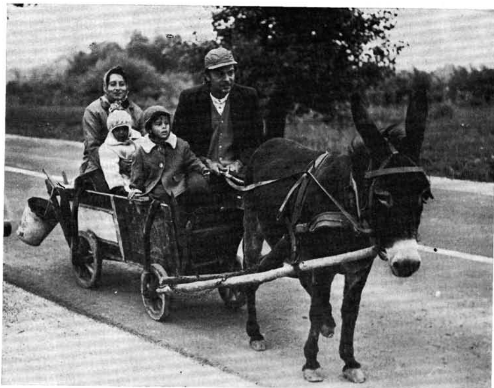
8. kép. Szamárfogat, Hidasnémeti

általában talyigát használtak. Ideiglenesen magában is befogták az állatot négykerekű szekérbe, egy rúd mellé, gyakoribb azonban ilyen esetben kétrudas szekér alkalmazása (6—8. kép). A két rúd között van elhelyezve a hámfa , melyre az istrángot erősítik. Adatainkból nem derül ki egyértelműen, hogy a két rúd alkalmazása korábbi fogatolásmódot őriz, vagy újabban elterjedt fogatolástechnikai megoldás. További feladat lenne — szélesebb körben — a szamár által vontatott járművek típusainak, elterjedésüknek a vizsgálata. Az adatközlők szerint az alkalmazott járműtípus a szállítandó anyagoktól függött, de azok minősége mellett lényeges volt mennyiségük is. A szőlősgazdák általában talyigát használtak, 20 mert könnyebben mozgott az emelkedőkön, ugyanakkor egy szamár kellett hozzá. A bükki meszesek viszont általában kétszamaras fogatokat használtak, mert ezt kívánta üzleti érdekük: minél messzebb vitték a meszet, annál drágábban adhatták el. S míg egy talyiga csupán 2,5—3 q terhet bírt el, addig két szamárral elvitt egy szekér 6—8 q-t is. 21