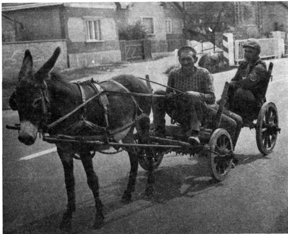
9. kép. Szamárfogat, Ózd

Él vidékünkön a szamár málházásának emléke is. A Hegyalján a szamár nyergére akasztották a terhet (lásd fentebb), Legyesbényén hosszú gabonászsák két végébe tették a terhet, s a zsák üres közepét helyezték a szamár hátára, a teher pedig lelógott az állat két oldalán. Ez utóbbi módon, Répáshután és