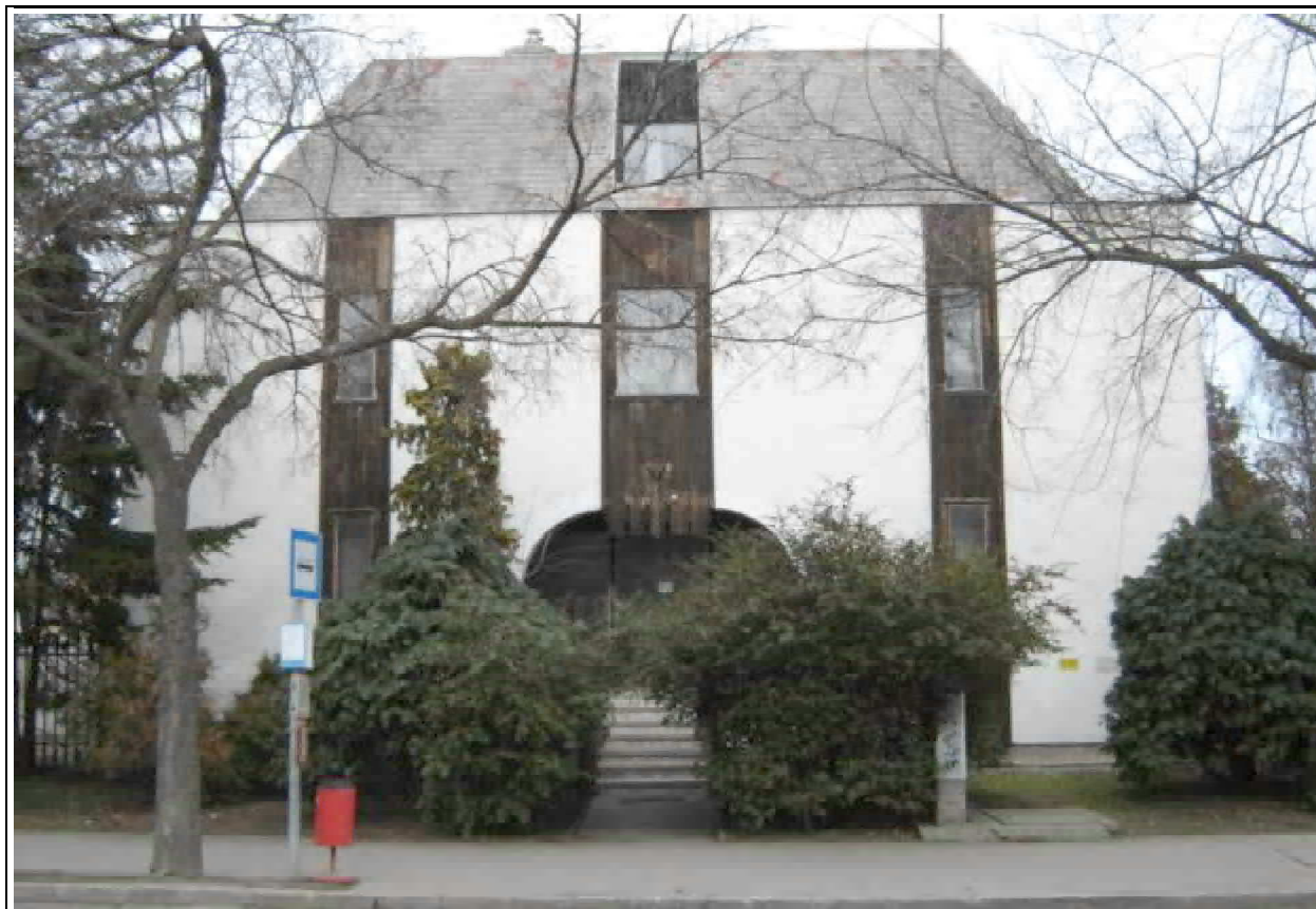
14. kép: A modern építészet jegyében épült a 24. számú ház. Kerítés itt nem készült, de az ültetett örökzöld fák már az emeletig nőttek.

Mára alaposan megváltozott a Kossuth Lajos utcának a városban betöltött szerepe. A déli pályaudvaron nem állnak meg a vonatok, az egykor forgalmas iparvágányokat benőtte a fű, az üzemek és gyárak jó része megszűnt, bezárt. Munkakezdés előtt kora reggel nem sietnek és kerekeznek munkások az üzemekbe, gyárakba, délután pedig nem özönlenek vissza százak és százak a városba. A villamos sem csörömpöl az utca szélén a Déliből az Újteleki utca felé. Ehelyett van autó autó hátán Sopronbánfalva, Brennbergbánya és Ágfalva felé. Sétánk végén, pihenésképpen betérhetünk egy kis vörösborért az utca egyik borozójába.