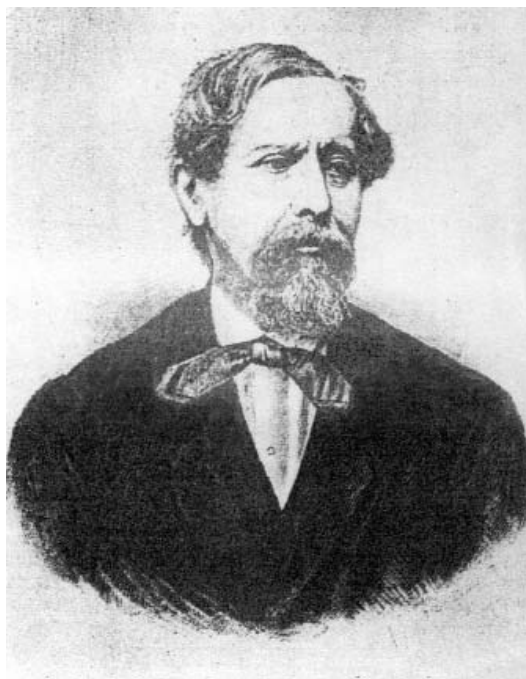
1. kép. Török József (1813–1894) arcképe Photo 1. Portrait of József Török (1813–1894)

A Magyar Tudományos Akadémia 1845-ben pályázatot írt ki egy balneológiai tankönyv megírására. A pályázat így szólt: „ Határozottassanak meg vegybontások s gyógygyakorlati adatok nyomán a nevezetes honi ásványvizek gyógyjavallatai; miként lehetne azokat netalán létező hiányaikra nézve orvosrendőrségi tekintetbe használhatóbbakká tenni; továbbá adassék elő, melyekkel lehetne azok közül a külföld legnevezetes ásványvizeit pótolni; végül említessék meg, mik történtek irodalmi tekintetben e tárgyra nézve? ”