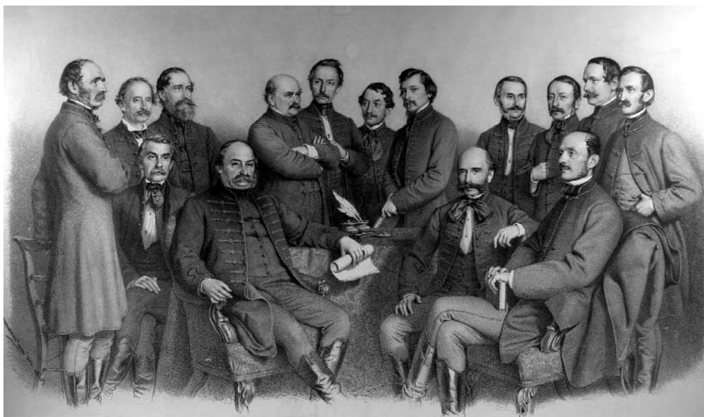
4. kép. Az orvosi kar 1863-ban Photo 4. The medical faculty in 1863