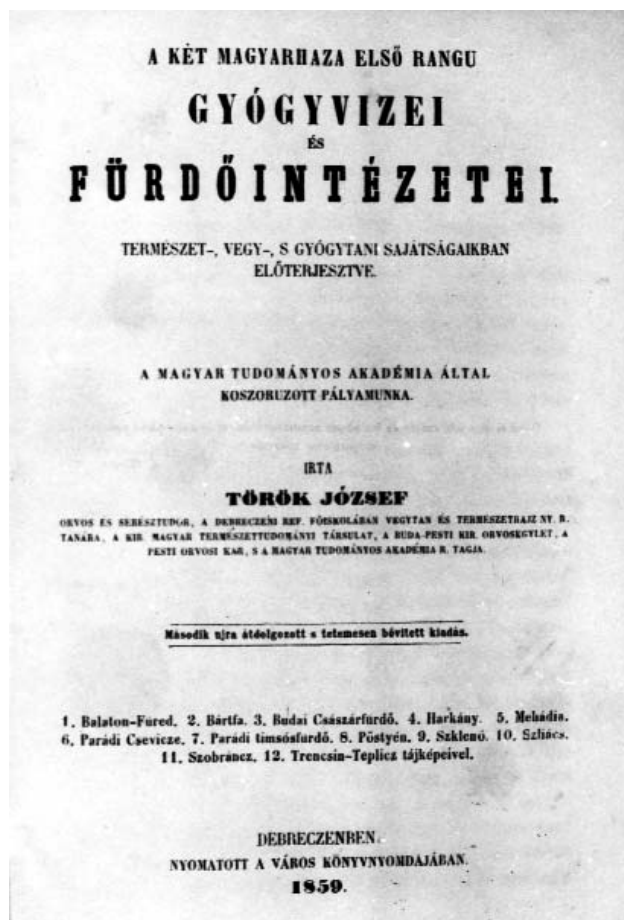
2. kép. Az 1859-ben megjelent ásványvíz-monográfia Photo 2. Monograph on mineral waters, published in 1859

Az akadémiai pályázatot Török József már mint főiskolai tanár, az akadémia levelező tagja nyerte el. Az 1847-i akadémiai nagygyűlés munkáját 50 arannyal jutalmazta. A következő évben a mű „A két Magyarhaza első rangú gyógyvizei és fürdőintézetei. Természet-, vegy-, s gyógytani sajátásaikban előterjesztve” címen Pesten jelent meg. Mivel a 2000 példány rövid idő alatt elfogyott, egy átdolgozott és jelentősen kibővített formában 1859-ben Debrecenben ismét kiadták (2. kép). A könyv a pályázati feltételeknek valóban megfelelt, igaz ő vegyelemzést nem végzett, de a Kárpát-medencében az addigi eredményeket minden tekintetben feldolgozta. A balneológiai irodalmat időrendi sorrendben, két részletben közölte, így az idegen (latin, német) nyelvűt 1549-től Carl HAUER munkásságáig bezárólag, míg a magyar nyelvűt 1631-től 1859-ig, majd külön tárgyalta a hévíz és a hideg vízű forrásokat. A 35 hévízű forrást, az akkor ismert osztályozás szerint, a legrészletesebben írta le, és minden forrásnál a történeti adatokkal vezette be mondanivalóját, ezután a földtani