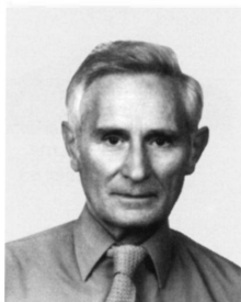
LIBOR Oszkár (1925. augusztus 9.)