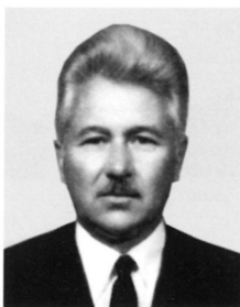
BÍRÓ Ernő (1925. november 4.)