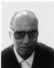
SZEREDI Miklós (1930. augusztus 31.)