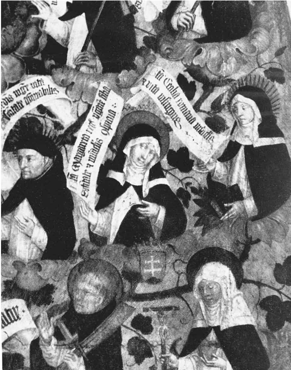
4b. kép. A berni volt dominikánus kolostor falképe a Domonkos-rend genealógiái fájával. Reprodukció. Részlet Árpád-házi Szent Margit alakjával