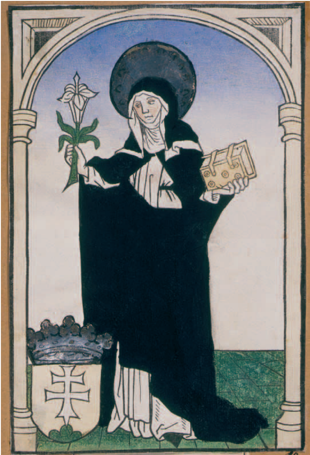
1. kép. Árpád-házi Szent Margit. Fametszet, 1473 előtt. Esztergom, Keresztény Múzeum Grafikai Osztálya.