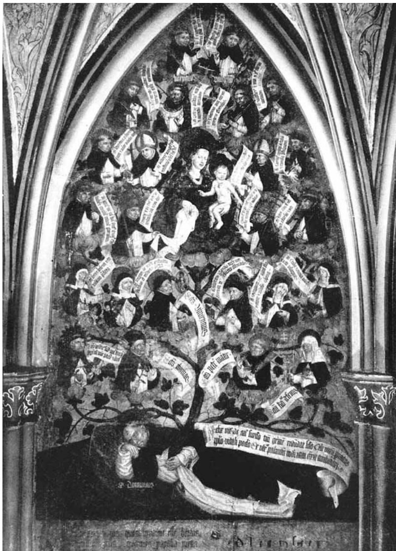
4.a kép. A berni volt dominikánus kolostor falképe a Domonkos-rend genealógiai fájával. Reprodukció Ybl Ervin 97. jegyzetben idézett közleménye nyomán

köthető, azaz hiteles attribútumainak bemutatása volt. Mellőzött, kikapcsolt minden misztikus elemet, illetve olyan motívumot, melyek erre utalhattak volna (kézben tartott feszület, stigma, vezeklésszerek). Ebben egyértelműen megnyilvánult az a szándék is, hogy világosan megkülönböztessék az 1461-ben kanonizált Sienai Katalintól, illetve a hozzá tapadó, s éppen az 1470-es években kulmináló stigmás botrányoktól. Ismeretlen alkotója mindenképp a történelmi hitelességet tartotta szem előtt, éppen azért, hogy ne lehessen teológiailag megkérdőjelezni. Grafikája egyszerre volt historizáló és modern – ez akkor határozottan korszerűnek számított. A metszet viszonylag nagy mérete utalhat könyvben való alkalmazására, de mintakép szerepére is, így a továbbiakban kiválóan lehetett másolni. A metszet sokak által felrótt „darabosságát”, egyszerűségét, mondhatni primitívségét éppen a közérthetőség, illetve az újabb, másodlagos felhasználhatóság szándéka magyarázza. Minden Margitra vonatkozó adat pontosan leolvasható