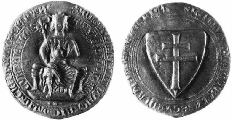
2. kép. IV. Béla király második kettőspecsétje, 1241 /1242. Szilikonmásolat, MTA BTK MI Pecsétmásolat Gyűjteménye, ltsz. 121

Margit végakaratóban meghagyta, hogy a dominikána templom hajójában, a Szent Kereszt mellékoltárnál temessék el, ahol Krisztus szent teste függ. Látszólag úgy tűnik, hogy misztikus életszentségének jeleit valamilyen oknál fogva nem akarták állandó attribútumai közé helyezni. De csak látszólag, mert a kereszt jelen van a képen, még ha nem is a kézben tartva, hanem úgynevezett dominikális ereklje formájában. A lap jobb oldalán álló címer ábrájáról eddig csupán azt közölték, hogy az nem más, mint a Magyar Királyság apostoli kettős keresztje, ami Margit királyi származására utal (2. kép). Kétségtelenül az, de ennél lényegesen több információ is elmondható róla, mégpedig olyanok, amelyek mindeddig elkerülték a kutatók figyelmét. Ha összevetjük a metszettel nagyjából egy időben készült szepeshelyi Szent Márton prépostsági templom főoltárának belső tábláin, a Magyar Nemzeti Múzeumban őrzött bártfai stalum hátfalán, Thuróczy János személynöki ítélmester 1488-ban Augsburgban kinyomatott Chronica Hungarorum ban, vagy az 1490 körüli, Szent Lászlót ábrázoló müncheni fametszeten szereplő címerek ábráival, első pillantásra megállapítható, hogy a metszet címerpajzsában megjelenő kettős kereszt típusa nem azonos velük! A felsorolt műveken felbukkanó kettős kereszt minden esetben egyenes szárú, a grafikán látható viszont enyhén szélesedő végű, s a függőleges szár egy csapot ábrázoló hegyes nyúlványban folytató-