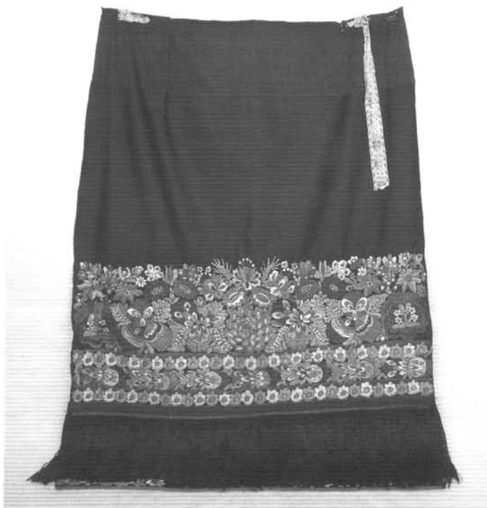
4. ábra. Matyó kötény. Ltsz.: 53.11.113. Figure 4. Matyo pinafore