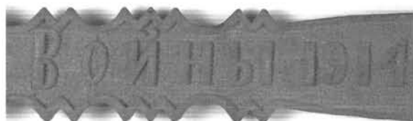
13. ábra. Cirill betűs felirattal ellátott faragott villa (oroszladifogoly munka, 1914–1918). Ltsz.: 72.3.128. Figure 13. Fork with russian subtitles (made by a russian prisoner of war, 1914–1918)