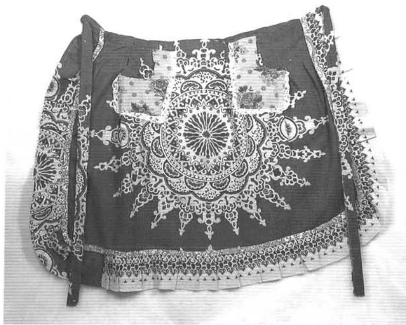
5. ábra. Kötény: cigány viselet darabja (Szatmárnémeti). Ltsz.: 82.12.3. Figure 5. Pinafore: part of a gypsy costume (Szatmárnémeti)