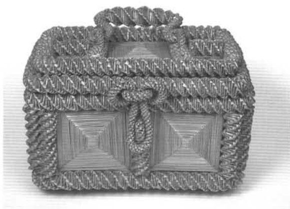
14. ábra. Szalmafonatos díszdoboz (oroszladifogoly munka, 1914–1918). Ltsz.: 54.27.1. Figure 14. Straw box (made by a russian prisoner of war, 1914–1918)