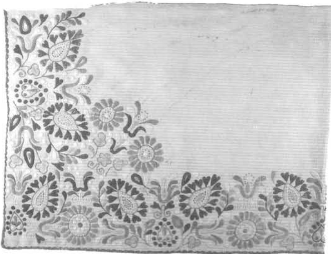
3. ábra. Hímzett lepedővég (Ormánság 1930-as évek). Ltsz.: 97.14.61. Figure 3. Couched sheet (South-Transdanubia, around 1930)