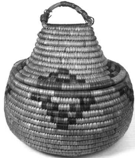
7. ábra. Fedeles kosár. (Afrika) Ltsz.: 55.222.5. Figure 7. Lidded basket (Africa)