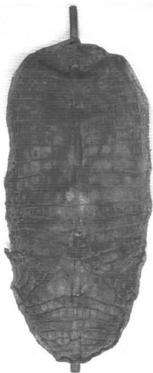
11. ábra. Krokodilbőr pajzs (Afrika?). Ltsz.: 53.10.9. Figure 11. Crocodile leather shield (Africa ?)