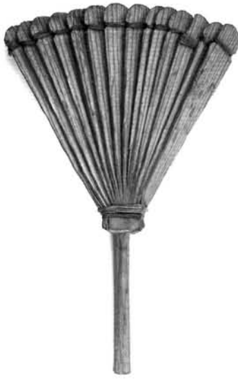
6. ábra. Boszniai fa legyező (Travnik, XIX–XX. század fordulója). Ltsz.: 54.9.29. Figure 6. Fan (Bosnia, around 1900)