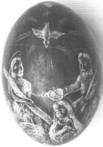
1. ábra. Festett, karcolt tojás (Hegyfalu, 1904 körül). Ltsz.: H 6 Figure 1. Painted egg (Hegyfalu, around 1904)