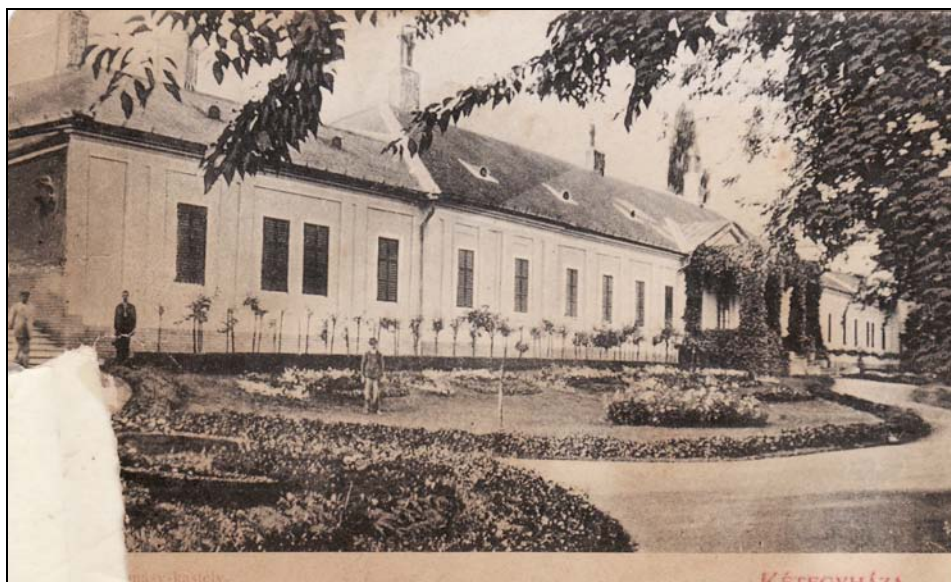
14. kép. Kétegyháza. Az Almásy grófok kastélya a 20. század elején. Jegyzék 208.