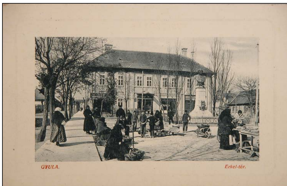
4. kép. Gyula. Az Erkel Ferenc tér 1912-ben. Jegyzék 91.