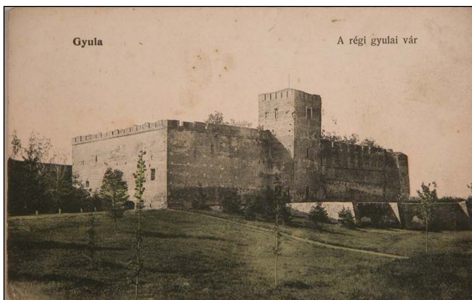
1. kép. A gyulai vár 1902-ben. Jegyzék 1.