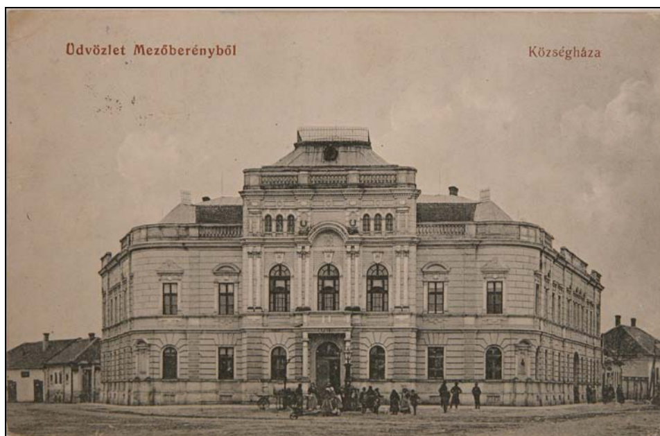
16. kép. A mezőberényi községháza 1922-ben. Jegyzék 218.