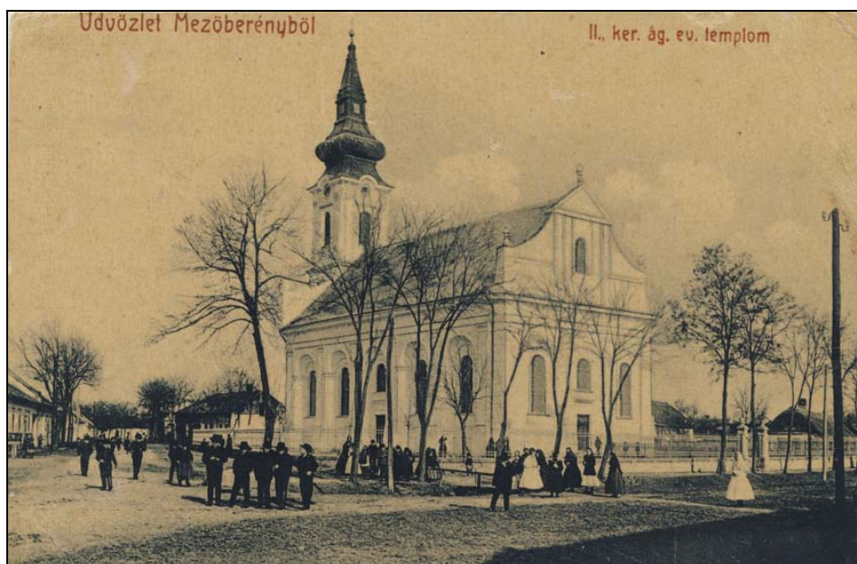
18. kép. A mezőberényi evangélikus templom a 20. század elején. Jegyzék 223.