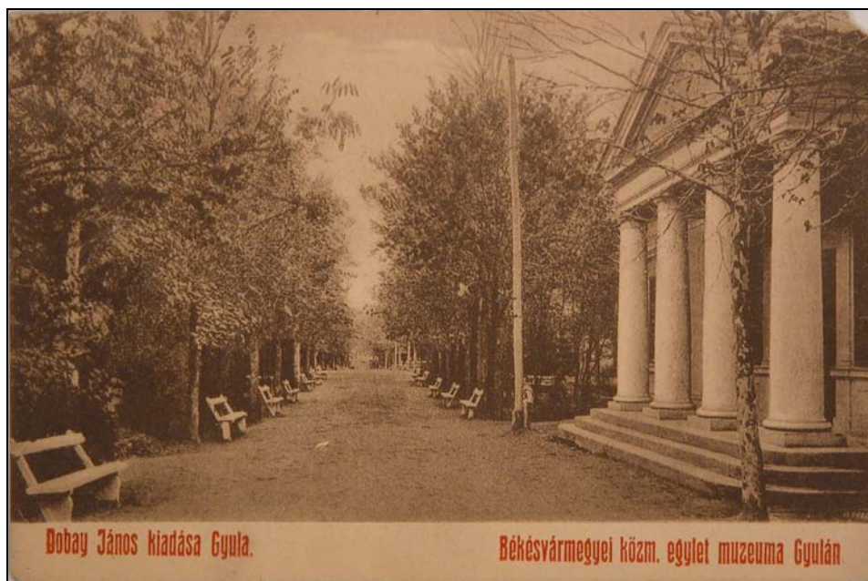
7. kép. Gyula. A Békés Vármegyei Közművelődési Egylet múzeuma 1911-ben. Jegyzék 99.