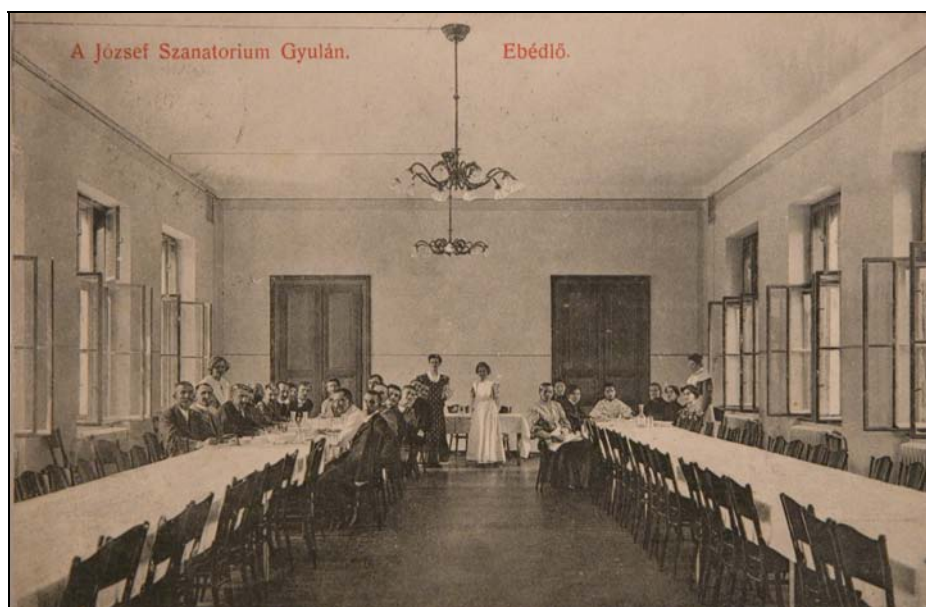
6. kép. Gyula. A József Szanatórium ebédlője 1907-ben. Jegyzék 45.