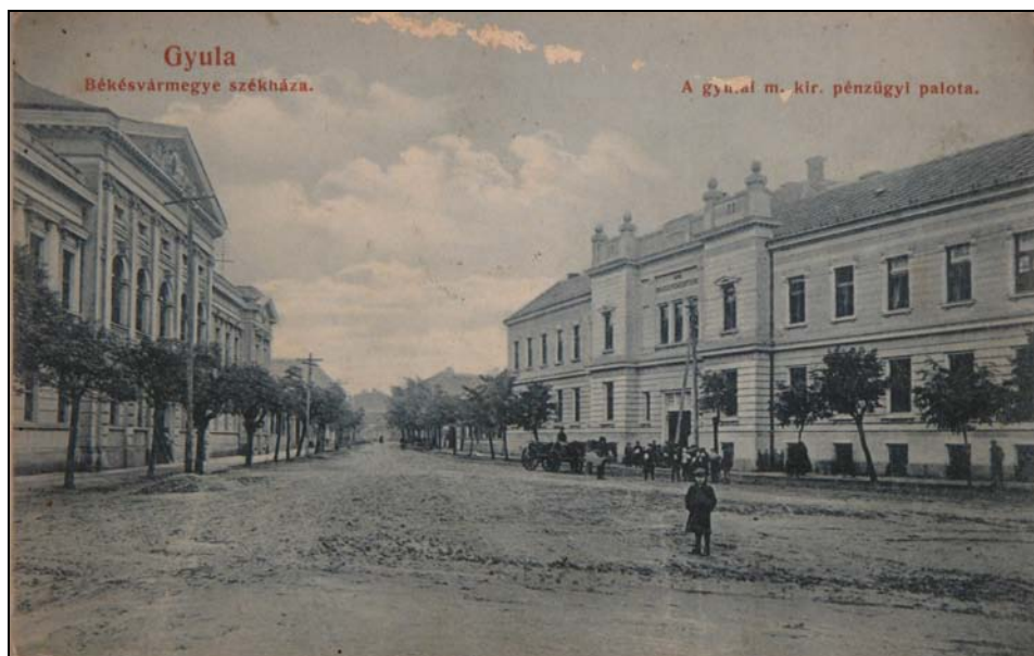
3. kép. Gyula. A Megyeház utca 1906-ban. Jegyzék 19.