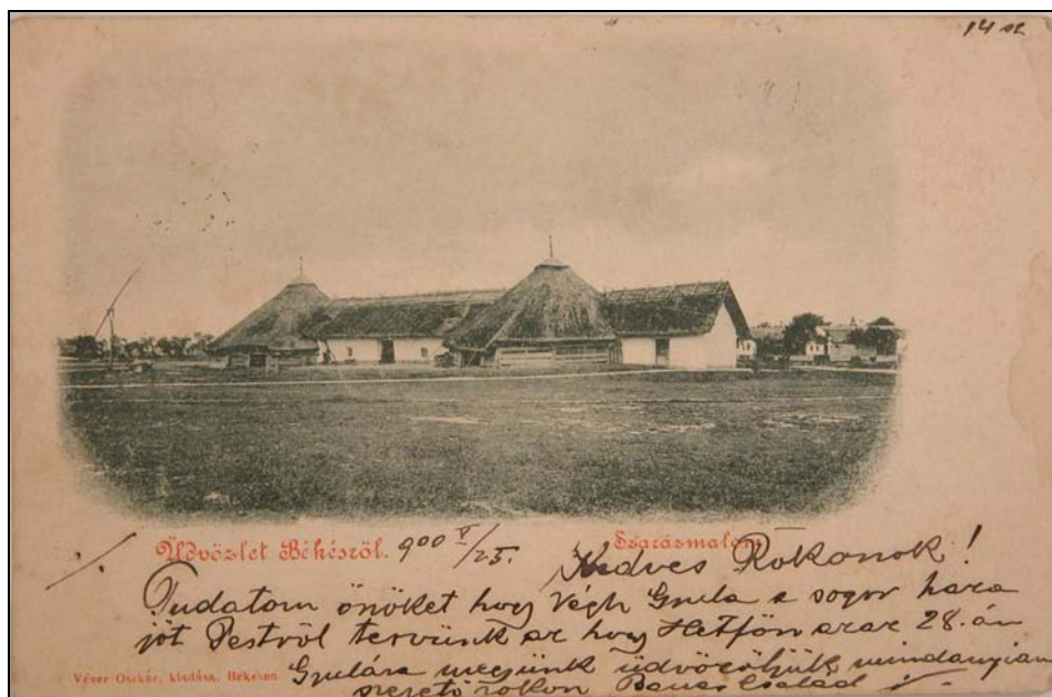
11. kép. A békési szárazmalom 1900-ban. Jegyzék 171.