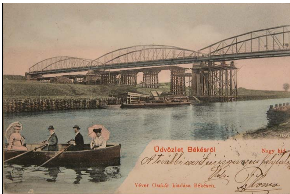
9. kép. Békés. A Kettős-Körös hídja a 20. század elején. Jegyzék 176.