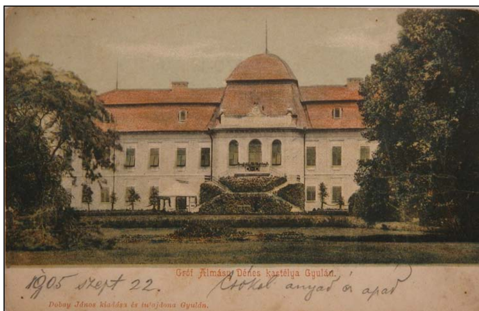
2. kép. Gyula. Az Almásy-kastély 1905-ben. Jegyzék 10.