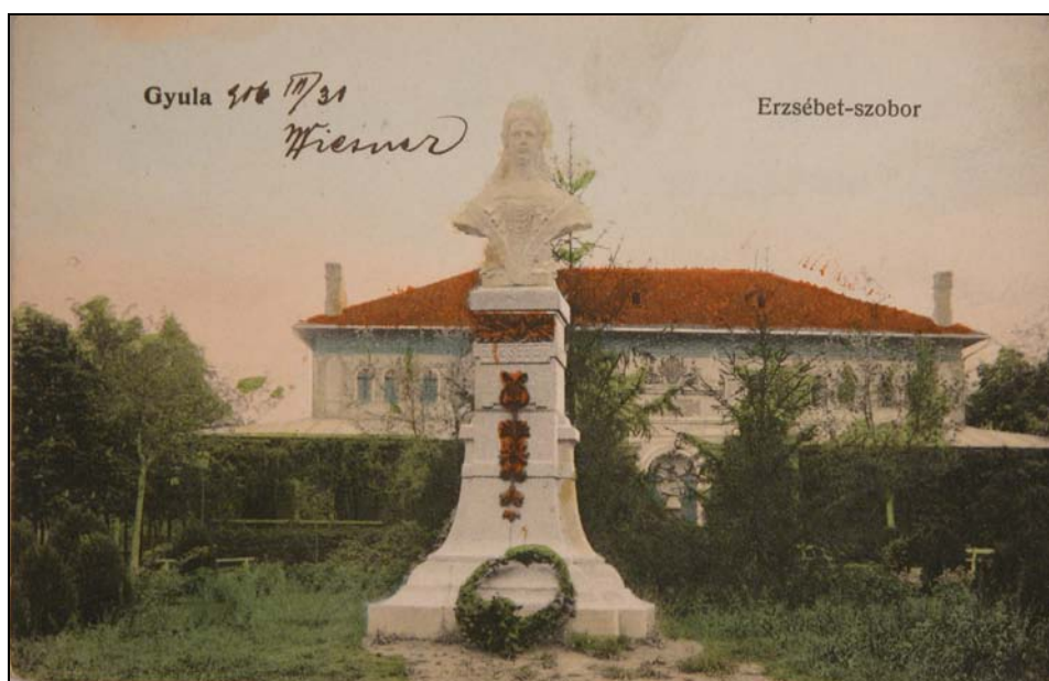
5. kép. Gyula. Erzsébet királyné szobra a 20. század elején. Jegyzék 100.