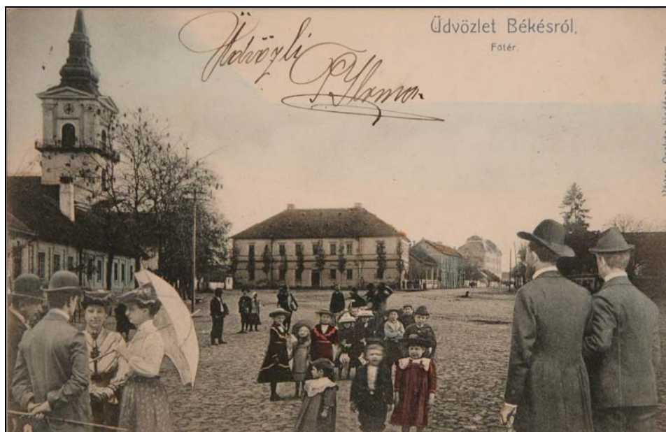
8. kép. Békés Főtere a 20. század elején. Jegyzék 149.