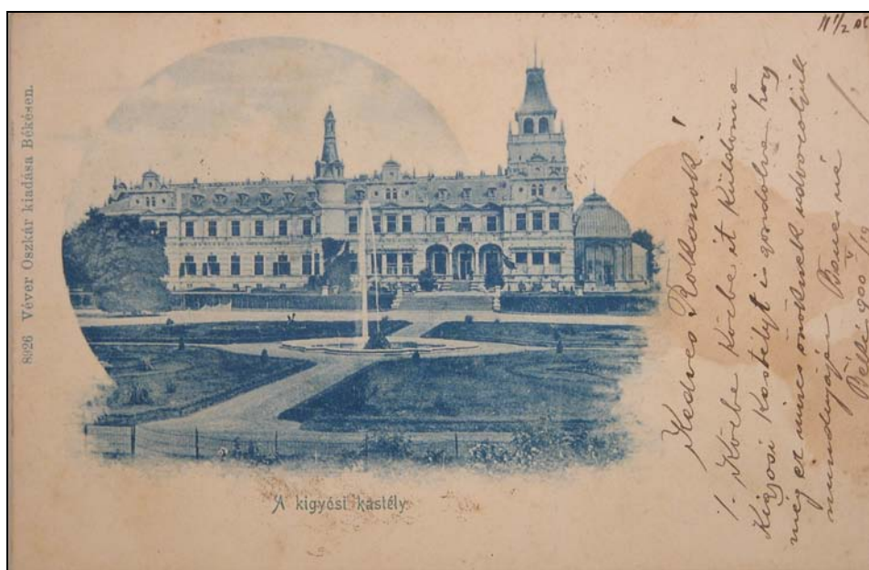
20. kép. Az ókigyósi kastély a 20. század elején. Jegyzék 235.