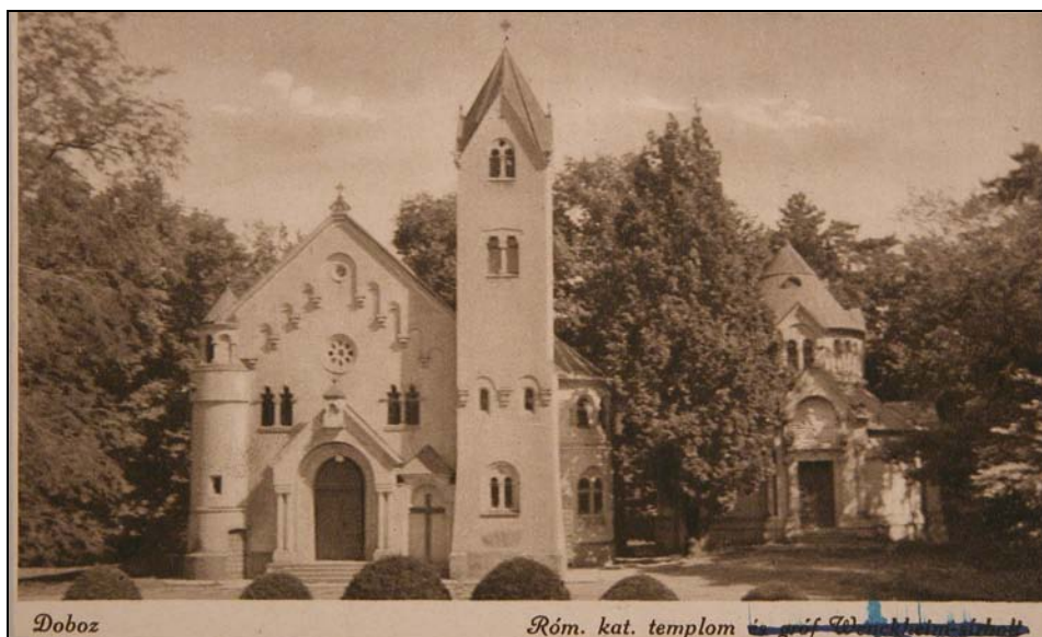
13. kép. Doboz. A katolikus templom és a Wenckheim grófok sírboltja az 1940-es években. Jegyzék 206.