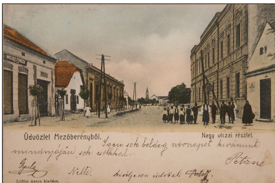
17. kép. A Nagy utca Mezőberényben a 20. század elején. Jegyzék 216.