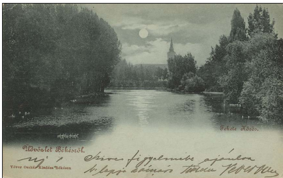
10. kép. Békés. A holt Fekete-Körös éjszaka 1899-ben. Jegyzék 177.