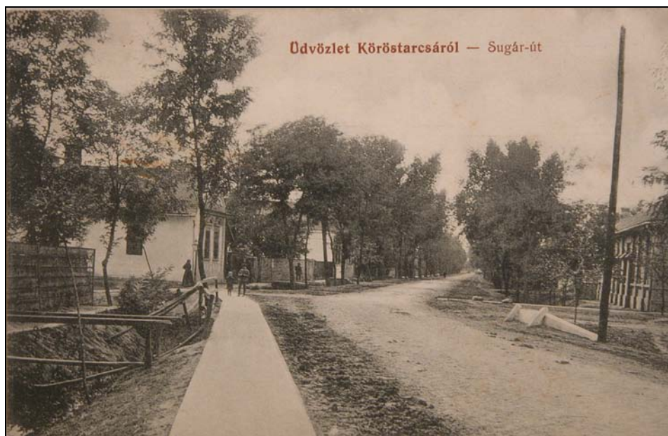
15. kép. Köröstarcsa az 1910-es években. Jegyzék 212.