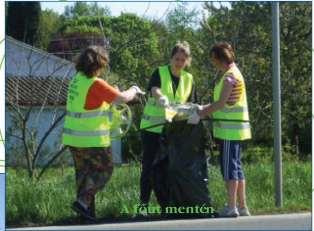
A főút mentén

Az akció célja a városba vezető utak megtisztítása volt, melyhez az önkormányzatnál jelentkezettek civil szervezetek, iskolák, baráti társaságok. A mohácsi csoportban a szőlőhegyi családok (felnőttek, nagyobb gyerekek) úgy gondoltuk, hogy csatlakozunk e felhíváshoz, mert szerettünk volna tenni valamit közvetlen környezetünkért. Elvállaltuk az 56-os számú főút szőlőhegyi bevezető szakaszának, valamint a mellette húzódó kerékpárút környékének szeméttől való megtisztítását 2 km hosszan a Vízkimelőtől a rendőrlámpáig. Önkormányzatunk örömmel fogadta a jelentkezésünket.