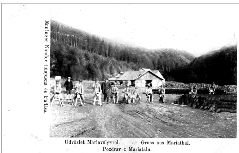
Képeslap Máriavölgyről palavágókkal, 1905-ből.