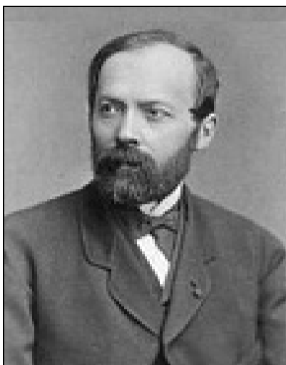
Paul Eugène Bontoux (1820 – 1904 vagy 1905).

Akárhogy is volt, Paul-Eugène Bontoux katolikus családban született, melynek az alkotmányos monarchiához való hűsége vitán felül állott. Diplomáját az Ecole Polytechnique de Paris azévi második legjobb diájaként szerezte, majd az Ecole des Ponts et Chaussées keretében folytatott tanulmányokat. 1842-ben kezdte meg fényesnek ígérkező mérnöki pályáját Hautes-Alpes megyében.