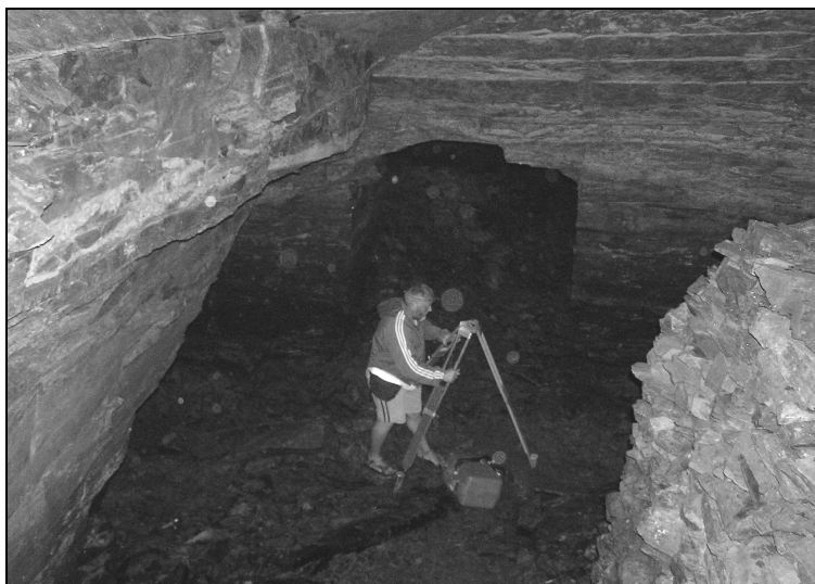
A 40 m hosszú, 4-6 m belmagasságú 18. századi palabánya fejtéskamrái ma.