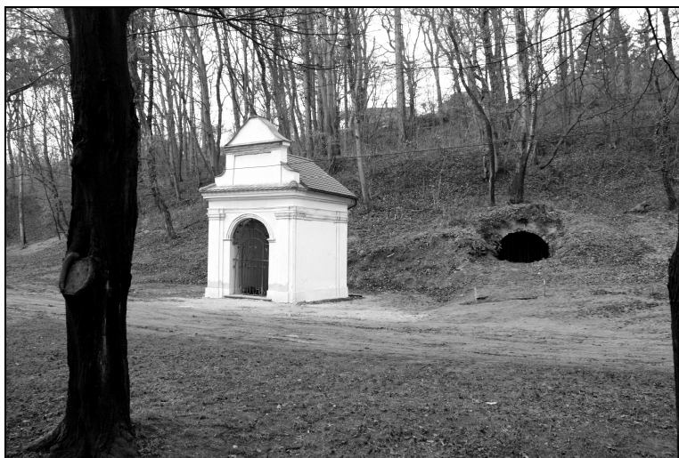
Máriavölgyben az egyik kápolna mögött föld alatti palabányát fedezték fel 2005-ben.